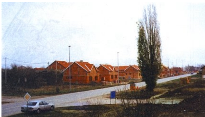
Obnovljene kuće na glavnoj cesti prema Iloku