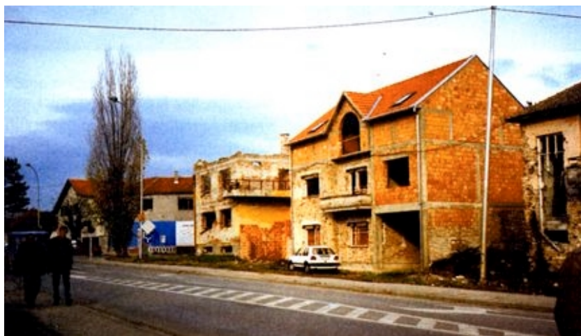
Niz kuća u kojem ima obnovljenih, neobnovljenih i jedna se kuća obnavlja

Posjetili smo neka vukovarska gradilišta, a provezli smo se i Mitnicom koja sada ima znatno drukčiji izgled negoli za našeg prvog obilaska prije nekoliko godina. Neke zgrade, posebno one s obnovljenim pročeljima, i s očigledno nadahnutim projektantima, izgledaju doista lijepo. Na mnogim su kućama obnovu potpomogli i sami vlasnici. No ukupan dojam kvare