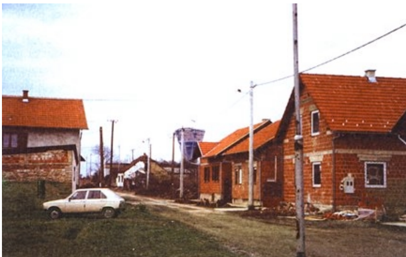
Obiteljske kuće koje se obnavljaju na Mitnici

bližavala središtu grada trebalo je nešto učiniti da Vukovar sačuva značajke urbane sredine da se grad ne bi obnavljao poput obližnjih Bogdanovaca. Kako se postojeći Zakon o obnovi nije mijenjao, Savjet je utemeljen upravo na inzistiranje grada i Županije, a činjenica je da se njegove odluke poštuju. Osnivanje Savjeta je određeno prijelazno rješenje, budući da stvarna koncepcija obnove grada ne postoji. Dosad je kompletno riješena Ulica Stjepana Radića, Mitnica i Trpinjska cesta te dio Borova naselja, ali središte grada, onaj dio koji je stvarni identitet jednoga grada, praktički je prava i neuređena rupa. Primjerice Radnički dom, koji je nekad davno bio vukovarski hotel i ključna gradska građevina, stoji neuređen i obrastao bujnom vegetacijom. Za njegovu se obnovu navodno izrađuje projekt, čuli su da ga radi Grozdan Knežević, dipl. ing. građ., ali se ne zna tko će ga obnavljati i kada će obnova započeti.