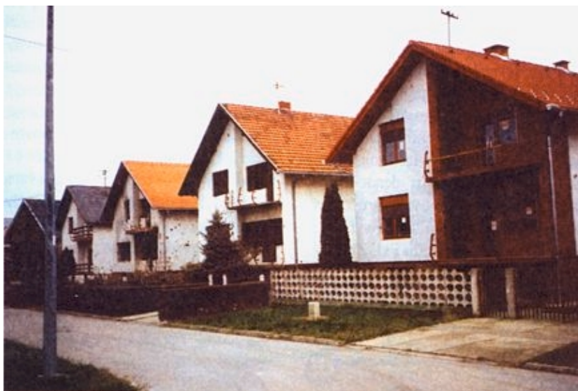
Niz obnovljenih obiteljskih kuća s urednim pročeljima

Kasnio je i početak obnove obiteljskih kuća u 2000. godini, jer je program obnove donesen tek u srpnju, a obnova je nakon izdanih uputa za građenje počela sredinom rujna. U Vukovarsko-srijemskoj županiji u programu obnove 2000./2001. približno je 850 kuća, od čega polovica dolazi na grad Vukovar. Inače u samom su gradu Vukovaru registrirane 7982 oštećene kuće, od čega 5217 pripada težim kategorijama oštećenja, a predano je 5766 zahtjeva. Od toga je do sada obnovljeno nešto manje od 2000., ali valja istaknuti da je od toga 471 obiteljska kuća (od kojih