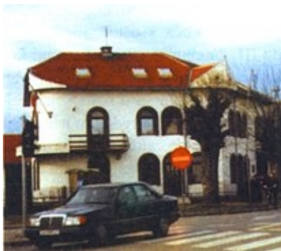
Obiteljska kuća obnovljena s novčanim dodatkom vlasnika

78 s teškim oštećenjima) obnovljena od strane međunarodne zajednice – njemačkog Arbeiter Samariten Bund , Norveške narodne pomoći i Norveškog vijeća za izbjeglice. Inače u cijeloj je Županiji predano 16.316 zahtjeva, a obnovljeno je 8852 kuća, što znači da je za obnovu preostalo 7464 obiteljskih kuća.