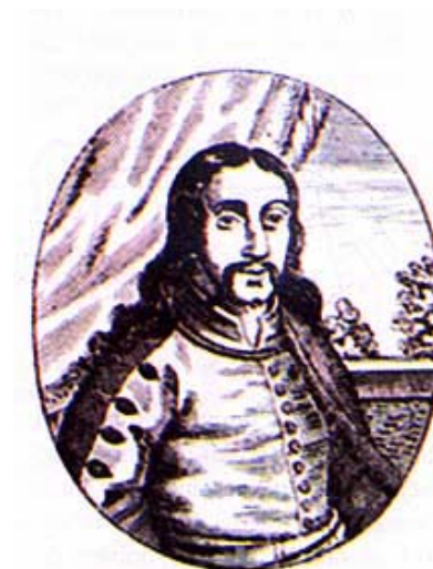
Fran Krsto Frankopan (1643.-1671.)

Oni su bili utemeljitelji Ozaljskoga književnog kruga zasnovanog na tronarječnom književnom jeziku s prevladavajućom čakavštinom. U krug su bili uključeni pisci Juraj Ratkay Velikotaborski i Franjo Glavinić, a njegov je član bio i prior obližnjega pavlinskog samostana u Sveticama Ivan Belostenec, koji je napisao enciklopedijski rječnik Gazophylacium . Zanimljivost jest da je Nikola (inače hrvatsko-dalmatinsko-slavonski ban) bio jedan od najznačajnijih mađarskih baroknih pisaca, a glavno mu je djelo Adriai tengernek syrenai brat Petar (također hrvatski ban) preveo i prepjevao na hrvatski kao Adrianszkoğa mora syrena .