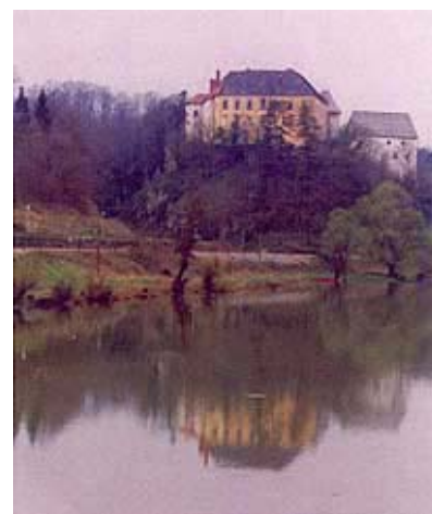
Pogled s mosta na ozaljsku utvrdu i dvorac

Grof Perlas je 1766. prodao uvećano imanje Ozlja, zajedno s Brodom i