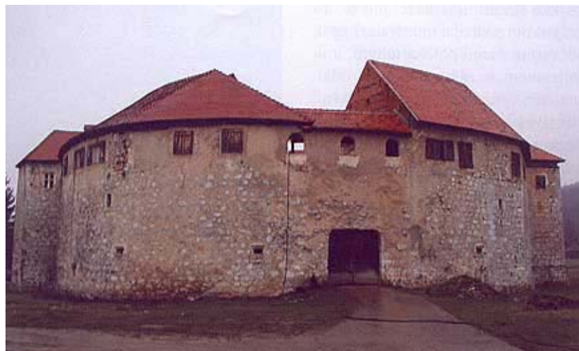
Sadašnji ulaz u utvrdu Ribnik

Od 1112. spominje se furlanska obitelj u osobi Federica di Caporiacco, a ta obitelj i danas postoji. Potomci Feredika u Furlaniji zvali su se "od Kaporijaka" ili samo "od Kastela". Frankopanima se prvi put nazivaju u diplomi koju je u Padovi 1487. stekao