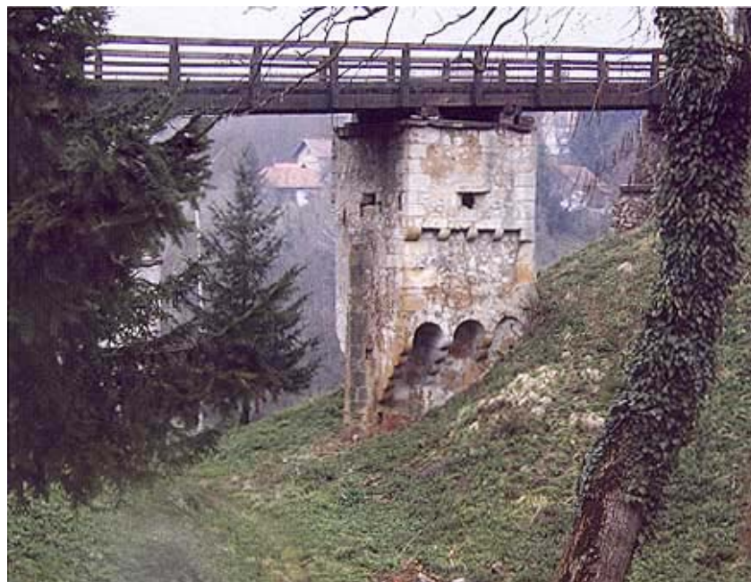
Kula kao stup ispod prilaznog mosta

pisne utvrde pokraj mosta 1908., na mjestu nekadašnjeg mlina, izgrađena jedna od prvih naših električnih centrala - tzv. Munjara grada Kar-