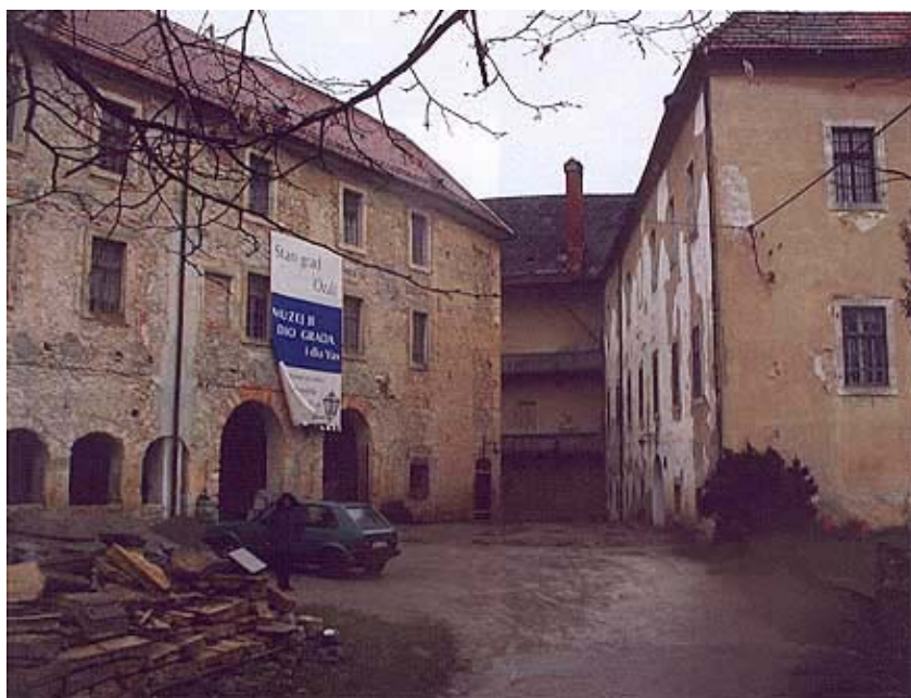
Detalj dvorišnog dijela

Sudbina je zamka Ribnik , koji je smješten jugozapadno, srodna sudbini Ozlja. Posjed Ribnik naprije su držali Babonići, potom ban Mikac Prodanić, a od 1394. Nikola IV. Frankopan. Frankopani su zamak najvjerojatnije podignuli i izgradili u obliku koji je uglavnom i danas sačuvan. Od 1576. u posjedu je Zrinskih, a nakon tragične bune u posjedu je grofova Petazzijevih. Ipak od 1839. u njemu stanuje general Filip Vukosović, graditelj Lujzinske ceste. Poslije ga je u vlasništvo dobio Josip pl.