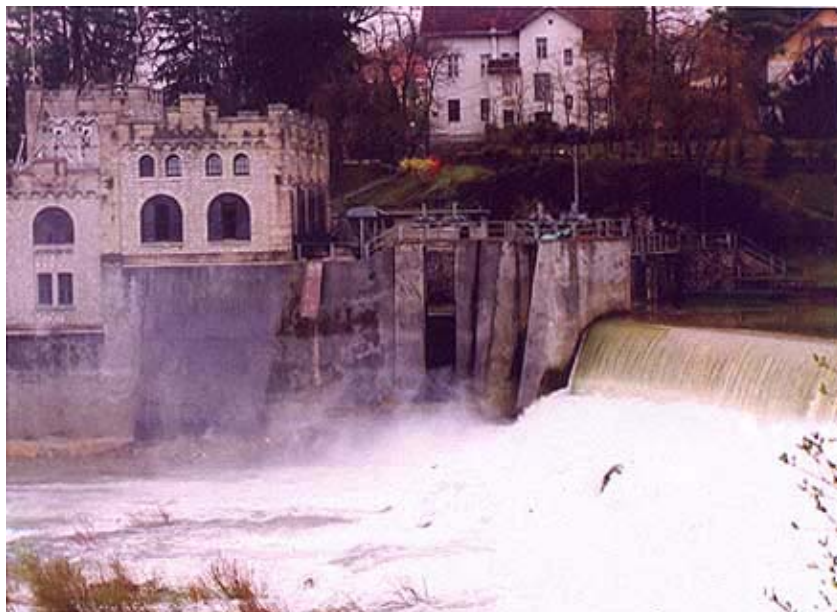
Ozaljska Munjaru i slap pored nje

Ozalj je nakon smrti Nikole bio središtem goleme Zrinske poludržave koja se prostirala od Mure do Jadranskog mora. To je ujedno bilo i središte pobune za oslobođenje zemlje od habsburške vlasti. Na Ozlju se nalazilo i najviše od golemog bogatstva Zrinskih i Frankopana s mnoštvom srebrnine, srebrom i zlatom ukrašenog oružja, draguljima obloženoga oružja i konjske opreme, kočija, dragocjenih sagova i slika, mnoštvo rijetkih knjiga, lusteri, tapeta, oklopa, ruha, kabanica, stolnog i posteljnog rublja, madraca, suđa, zrcala, pokućstva i puno platna, svile i brokata te koza, ovaca, žita, vina, masla i sl. Sve su to nemilice 1570. zaplijenili vojnici karlovačkog generala Josepha Herbensteina, pod komandom baruna Fridricha Saurera. Kao i drug-