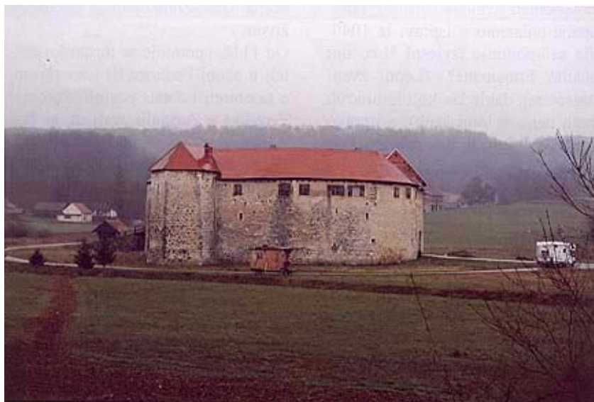
Pogled na ribničku utvrdu

Na ovoj lijepoj i dobro očuvanoj utvrđi sačuvan je niz kasnogotičkih renesansnih arhitektonskih detalja,