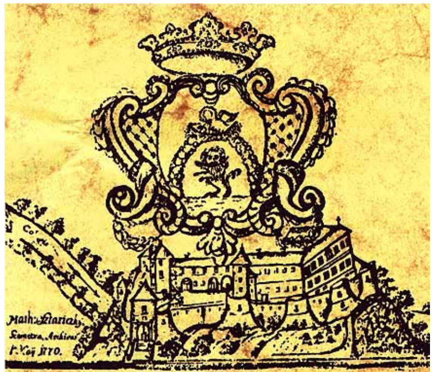
Ozalj na stiliziranom crtežu iz 18. st.

joj je bila Gorica, koja se poslije prozvala Budački ili možda Steničnjak. Na prostorima između Kupe i Krke, u povelji Marchia Hungariae iz 1195., spominje se kao vlasnik Stjepan I. Gorički, inače prvi Babonić (Baboneg). Vjerojatno im je Ozalj služio kao branik od provala