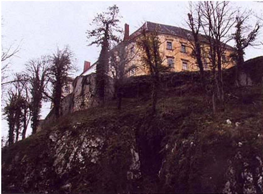
Stijena i jugoistočni dio utvrde

Grobnikom, grofu Teodoru Bathyanju, a prodaju je odobrila i kraljica Marija Terezija. Grof Bathyany bio je daleki rođak sigetskog junaka Nikole Zrinskog, a nadgradio je sjeverno krilo dvorca te jednu novu zgradu. Bathyany je mnogo učinio za razvoj Ozlja otvaranjem tvornice platna, ciglane i nadaleko znanog staklenika.