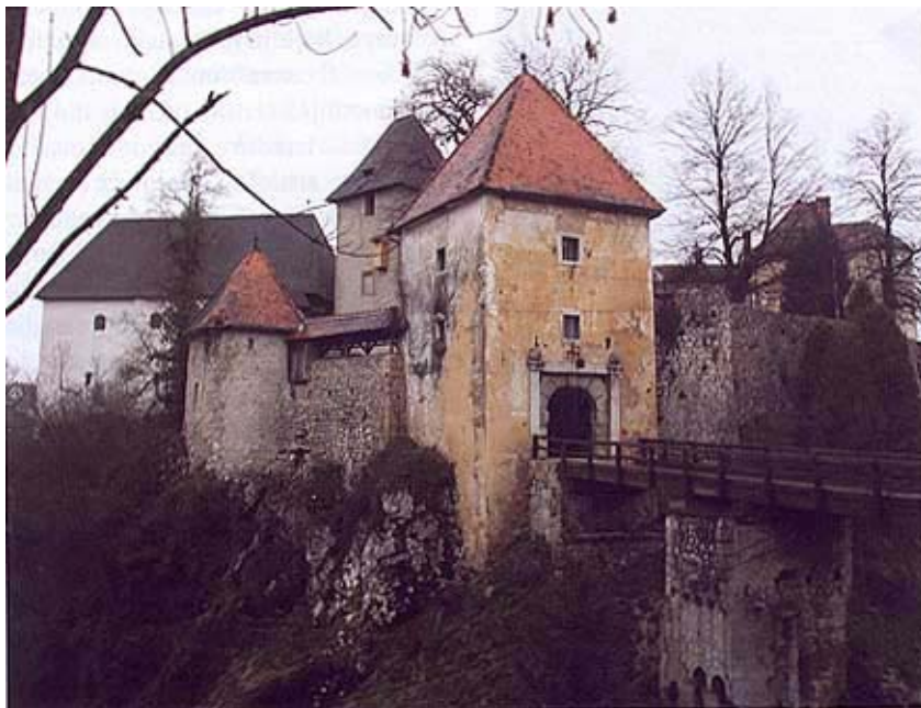
Ulaz u utvrdu

Ulazna je kula izgrađena 1599., o čemu svjedoči i zapis u podnožju obližnje polukule, kojih ima pet u zidu što okružuje cijelu utvrdu. Vjerojatno se još do 1821. most podizao, a o tome svjedoče sačuvani kolotur-