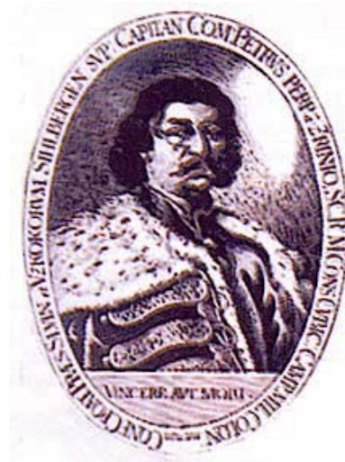
Ban Petar Zrinski (1621.-1671.)