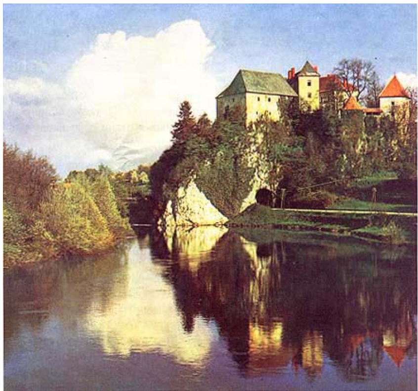
Pogled na sjeverozapadni dio utvrde

Iz darovnice kojom su Braća hrvatskog zmaja dobila dvorac u Ozlju vrijedno je kao zanimljivost izdvojiti kako je u njoj gotovo sve predviđeno. Predviđeno je kome Ozalj pripada ako Družba bude ukinuta (Družba je bila ukinuta 1945.), ali je predviđeno i da se ukoliko ponovno bude uspostavljena ista ili slična udruga, Ozalj mora njoj vratiti na upravljanje, ako za to bude interesa. Družba je obnovljena 1990., a nedavno je na upravu ponovno dobila ozaljski zamak. U dvorcu je u međuvremenu djelovalo narodno sveučilište Ivan