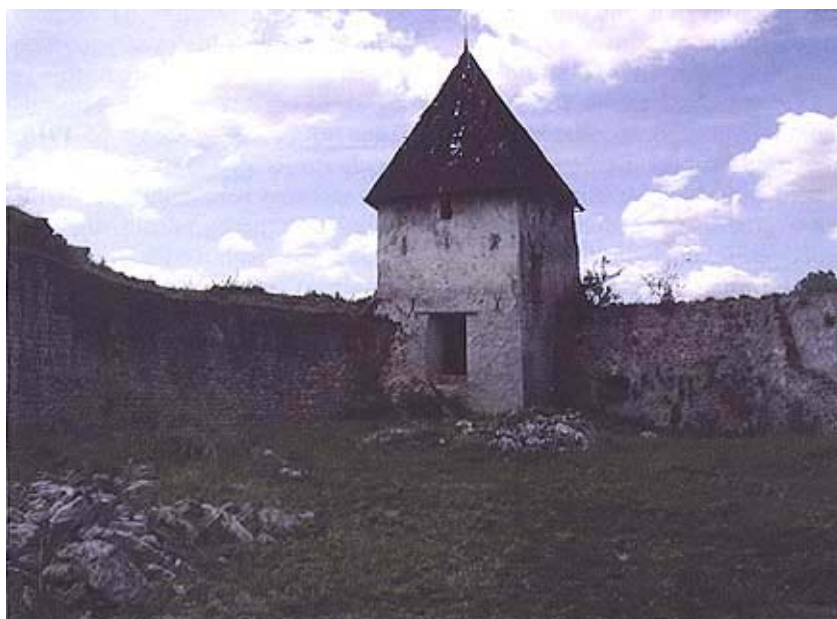
Četvrtasta kula s unutarne strane utvrde

Valja reći da se odmah nakon oslo-bođenja u Kostajnici počela graditi velika barokna i zemljana utvrda na Djedu, na prostoru koji je dominirao cijelim prostorom Kostajnice, unsk-im otokom i desnom obalom Une. Ta se utvrda dugo gradila, sudeći po crtežima bila je četvrtasta s drvenim čardakom u sredini, a radovi su na njoj sve više zapinjali što je slabila važnost Kostajnice kao vojnog upo-rišta. Postupnim razvitkom trgovine s Bosnom prioritet su dobile druge zgrade potrebne za zaštitu trgovine