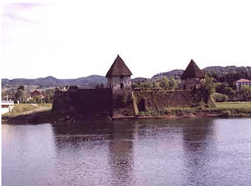
Utvrda Stari grad uz obalu Une

Zna se da je u ljeto 1556. Kostajnicu branila posada s više od 60 vojnika. Malkoč-beg se s jakom vojskom utaborio na lijevoj i desnoj obali Une te zatvorio sve pristupe do kostajničkog grada i započeo opsadu. Obranom kostajničkoga Starog grada zapovijedao je Pankracije Lusthaller podrijetlom iz Ljubljane. Opsada je započela 15. srpnja, a već idućeg dana utvrda se umjesto očekivane i uspješne obrane predala. Kostajnica je zapravo izdajom i bez borbe pala u ruke neprijatelja. Prema nekim izvještajima Lusthaller je prodao utvrdu za 2000 dukata. Tako je pala najbolje utvrđena i najbolje branjena utvrda na Uni, utvrda o kojoj je ovisila obrana cijelog Pounja. Turci su