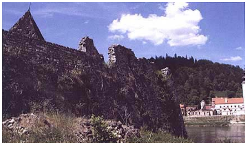
Istočni zid utvrde

Iz Kostajnice su pokretani napadi na ostale dijelove Banovine, a pošto su Turci 1592. zauzeli Bihać iz nje su pokrenuti napadi koji su do kraja pokušali slomiti hrvatsku obranu. No nakon teškog poraza kod Siska i potom kod Petrinje, Kostajnica se pretvorila u tursko utočište. U to je vrijeme banska vojska započela napadima s namjerom da Kostajnicu oslobodi. Godine 1595. turska je vojska u klancu Šapcu pred Kostajnicom doživjela težak poraz, ali su se vojnici u bijegu uspjeli skloniti u utvrdu. Najbolje su organizirani napad na Kostajnicu, ali također neuspješan, izveli hrvatski i krajiški vojnici sljedeće godine. Vojsku je vodio varaždinski general Sigismund Herberstein. Zauzeli su naselje na lijevoj obali, prešli Unu i okružili utvrdu, ali nisu imali dovoljno snage za zauzimanje utvrde koja je imala čvrste kamene zidine ojačane zem-