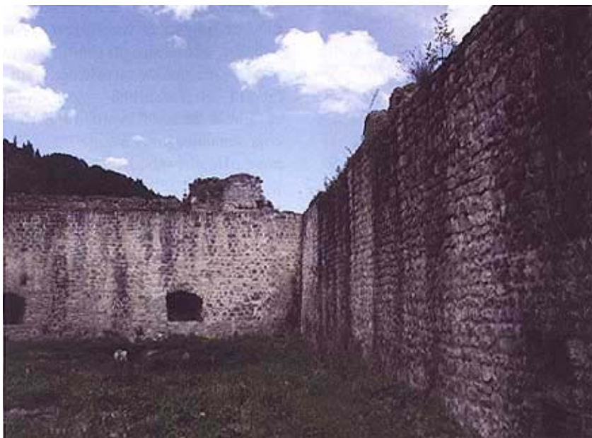
Iz unutrašnjosti utvrde

ljom s unutrašnje strane. Ban Juraj Zrinski, a Zrinski se nikad nisu pres-tali brinuti o svojoj djedovini u Pou-nju, također je neuspješno 1624. napao Kostajnicu, a učinio je to isto 1651. i ban Nikola Zrinski.