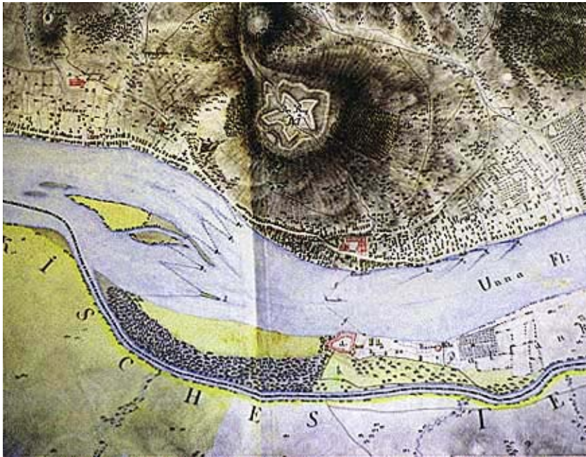
Utvrdivanje na rijeci Uni