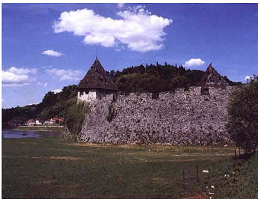
Pogled s juga na utvrdu

Pad Kostajnice bio je velik gubitak koji je posve poremetio obrambene