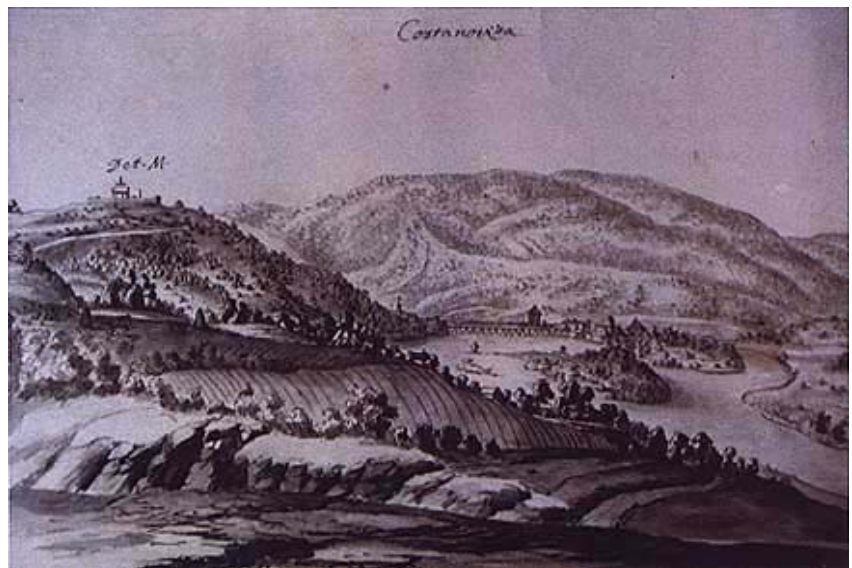
Kostajnica na crtežu M. Weissa