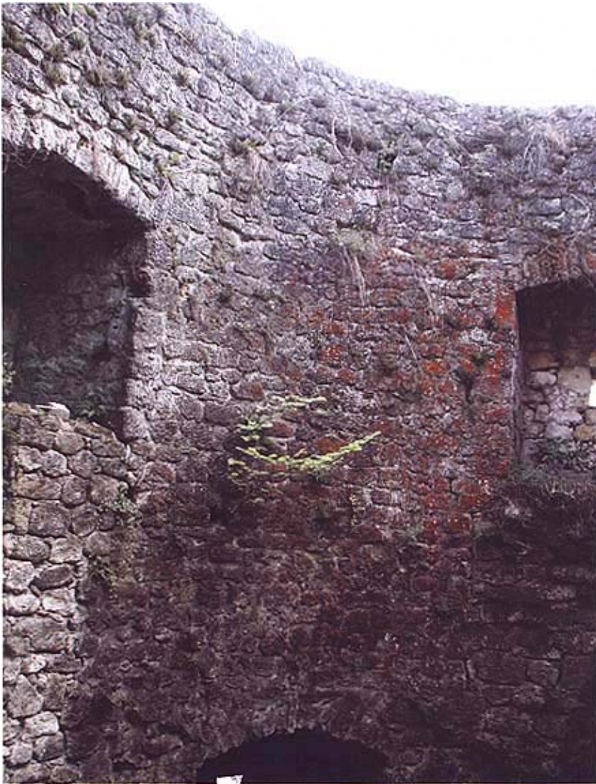
Detali visokog kamenog zida utvrde

planove i hrvatskog plemstva i kralja Ferdinanda. Svakako je njezin pad izdajničkom predajom bez borbe najteže primio Nikola Zrinski koji se je za obranu te utvrde zaista mnogo potrošio. Navodno je iznenađeno 1558. napao i osvojio Kostajnicu. To ipak nije precizno utvrđeno i potvrđeno, posebno stoga što se zna da je Kostajnica 1559. bila u turskoj vlasti. Štoviše i Novi i Kostajnica postale su turske utvrde iz kojih će u idućih pola stoljeća polaziti turska vojska na svoje pohode preko Banovine do Pokuplja pa i do Zagreba. Turci su Kostajnicu pretvorili u veliku ratnu utvrdu. Građevinski su