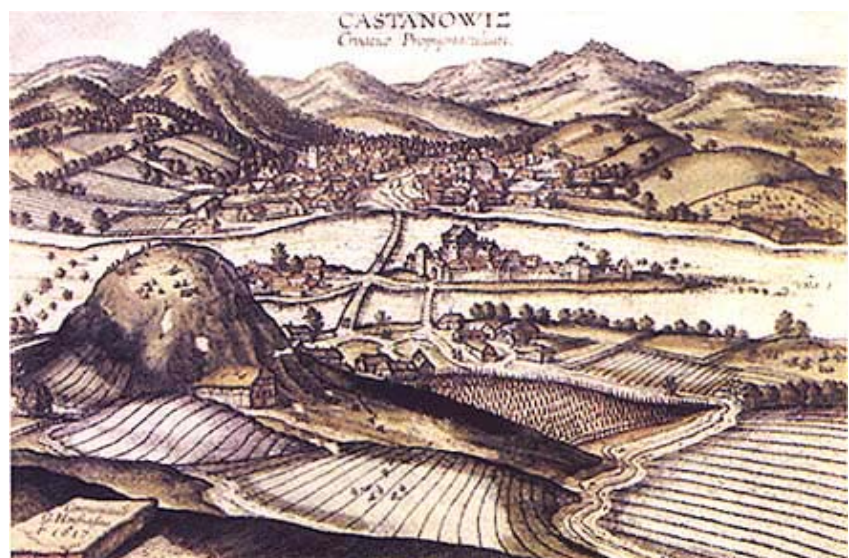
Stara gravura Kostajnice

U srednjem je toku Une najvažnija obrambena utvrda bila stara Kostajnica, smještena nad unskim otokom pred starim hrvatskim naseljem ispod brijega na lijevoj obali rijeke. Njezini su je gospodari Zrinski nazivali "glavom i vratima cijele Hrvatske". Stoga su je i čuvali više negoli ijednu drugu i za njezinu su obranu i trošili najviše novca. To su im omogućivali rudnici srebra u Gvozdanskom, a kad su ti izvori presušili bili