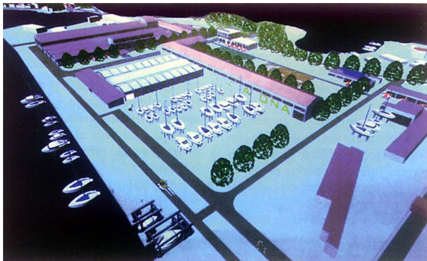
Budući izgled tvorničkog kruga kada bude pretvoren u nautički centar

"Lokacija je izvrsna zbog blizine srednjodalmatinskog arhipelaga, stabilnih ljetnih vjetrova, ali i autoceste, koja će u Vranjic privlačiti i turiste iz kontinentalnog dijela Europe. Za ovaj projekt sigurno postoji tržište, jer prema istraživanjima Instituta za turizam, u ovom trenutku Hrvatskoj nedostaje oko 12.000 nautičkih vezova", kazala je Nataša Zekan, suvlasnica Doxtusa .