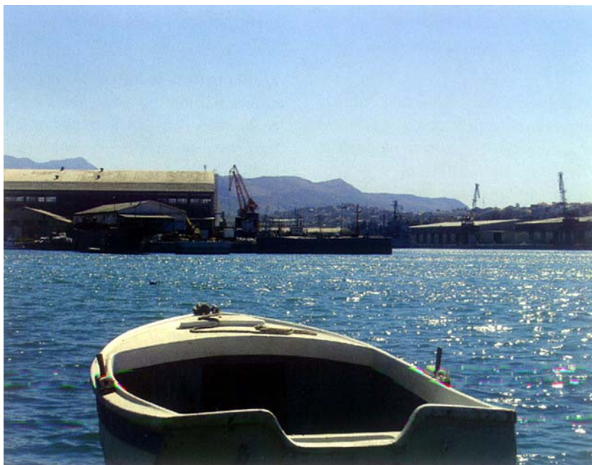
Pogled s Vranjičke rive na tvornicu

A radi se možda o mnogo jednostavnijem postupku. Rušenje tvornice nije rješenje za radnike, ako oni bolesni i nezaštićeni ostanu na ulici, a onome tko kupi 80.000 četvornih metara zemljišta na najboljoj lokaciji na cijelom području s uređenom operativnom obalom, ne ostane nikakva financijska obveza prema njima. Priča o sigurnosti taložnice za otpadne vode prilično je smiješna. Jer da se u toj zelenkastoj velikoj