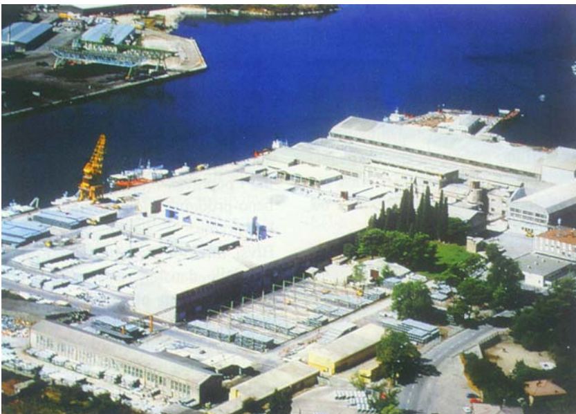
Pool na tvornicu Salonit u Vranjici

U međuvremenu je u razdoblju od dvije godine umrlo 20 oboljelih od azbestoze. To više nije pomalo šaljiva priča o čovjeku koji je zbog vrabaca obolio od azbestoze. Naime bio je svoju kuću pokrio azbestcementnim pločama, a vrijedni vrapci su valjda ocijenili da ta mješavina može biti dobra građa i za njihova gnijezda. Stoga su isključali krov i rasijavali azbestna vlakna jer vlakna u cementu bitno ne mijenjaju svoju strukturu i štetnost. Oslobođena od veziva vlakna se ponašaju jednako kao i ona tek dopremljena nekim