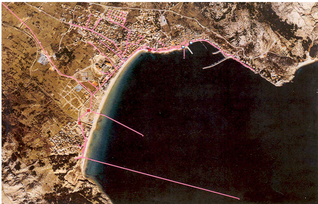
Slika 3. Situacija Baške s ucrtanim kanalizacijskim sustavom i ispustima u more

općinom. Tada nastaje pravi turistički procvat, posebno nakon što je Hotelsko poduzeće Baška transformirano u dioničko društvo ( Hoteli Baška d.d.). Značajno je povećan broj postelja, ali je mnogo važnije da je znatno podignuta kvaliteta smještaja. Hotel Chorintia nakon preuređenja dostiže razinu od tri zvjezdice, a potom dodatnim ulaganjima i autokampovi Zablaće i Bunculuka . Nakon 2001. otvaraju se i prvi hoteli s četiri zvjezdice (depandansa Zvonimir kao garni hotel, a depandansa Adria kao apartmanski hotel). U Baški posebno vole isticati 2003. kada su ostvarili 723.000 noćenja i imali 114.000 gostiju, više nego dvostruko od 52.259 posjetitelja, koliko je Baška ukupno imala između dva svjetska rata (od 1921. do 1940.). Danas u jednom danu Baška može primiti i više od 10.000 gostiju.