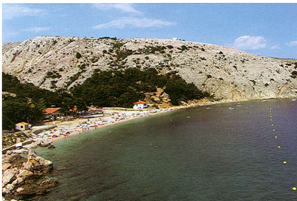
Slika 4. Plaža ispred kampa Bunculuka

Stoga i ne treba čuditi da Baška danas nije poznata samo