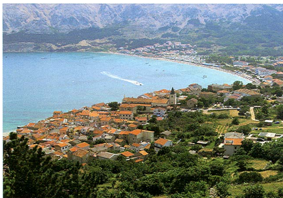
Slika 1. Pogled na Bašku danas

Mjesto i općinsko središte Baška na otoku Krku prošle je 2004. proslavilo stotu obljetnicu organiziranoga turističkog djelovanja. Toliko je naime prošlo od 1904. i temeljenja Društva za poljepšanje mjesta i mjestne čistoće s kojim je započeo suvremeni turizam. Dvije godine poslije otvoren je prvi hotel Zvonimir , a 1908. prvo kupalište na cijelom otoku s 18 kupališnih kabina.