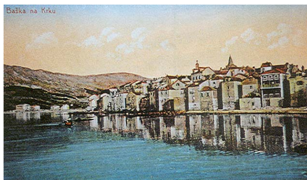
Slika 2. Stara razglednica Baške

Najznačajnije su promjene nastupile 1994. kada je pre ustrojem lokalne uprave i samouprave Baška postala