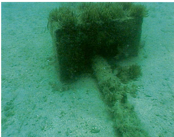
Slika 6. Cijev podmorskog ispusta s betonskim opteživačem

Tvrtka Hoteli Baška odmah je angažirala profesionalne ronioce da djelomično otklone uočeno oštećenje. Najprije je saniran betonski zidić oko napukle cijevi, a time je spriječeno daljnje istjecanje zagađenih otpadnih voda.