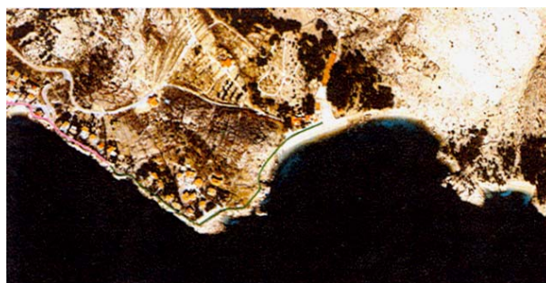
Slika 8. Ucertani budući spoj kanalizacijskog sustava Baške i kampa Bunculuka

Odmah su angažirani profesionalni ronionci koji su otkrili da je na nekoliko mjesta oštećena cijev podmorskog