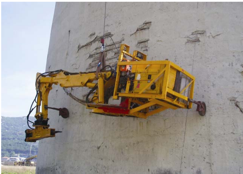
Podizanje bagera na vrh

Nakon rušenja krune na vrhu dimnjaka su montirane dvije dizalice. Jedna je služila za prijenos opreme po vrhu dimnjaka, a uz pomoć druge je u dijelovima s vanjske strane podignut bager s hidrauličnim postoljem i nogama te montiran na vrhu dimnjaka. Potom je montirana zaštitna radna skela oko plašta dimnjaka koja je poslužila kretanju strojara