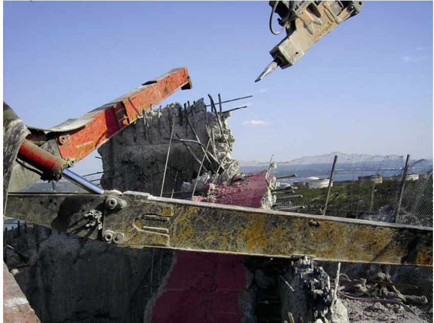
Razgradnja posljednjih ostataka dimnjaka

Rušenje dimnjaka samo je još jedna faza u saniranju okolnog tla i podmorja za koje je također utvrđeno da je zagađeno. Razmontirat će se podvodni tunel i od uljnog onečišćenja sanirati podmorje i tlo od koksnog katrana u bivšem kemijskom postrojenju. Za to će u sljedeće tri godine Fond za zaštitu okoliša i energetske učinkovitost izdvojiti 18 milijuna kuna, iako će to vjerojatno stajati mnogo više. No računa se da će, kao i sada, određena financijska sredstva dati i državni proračun, ponajprije Ministarstvo gospodarstva, te se vjeruje da bi konačna razgradnja koksare