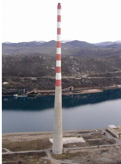
Dimnjak prije rušenja

Upravo je uspješno srušen sa zemljom armiranobetonski dimnjak koksare u Bakru, posljednji vidljivi ostatak negdašnjega industrijskog kompleksa u pitoresknom zaljevu, koji je ujedno bio i simbolom najvećega i najgorega zagađivanja naših obalnih prostora. Rušenje dimnjaka visokoga 250 m uspješno je u samo 103 radna dana polaganim "grickanjem", s pomoću specijalizirane te prilagođene opreme i mehanizacije, obavila tvrtka Eurco d.d. iz Vinkovaca. U toranj je bilo ugrađeno 3300 m 3 armiranog betona, 380 m 3 šamotne opeke, 58,5 t čeličnih konstrukcija i više od 400 t armaturnog željeza. Preostali će dio razgrađenog materijala biti do kraja godine usitnjen uz pomoć posebnoga pokretnoga drobilnog postrojenja i vjerojatno namijenjen daljnjoj uporabi.