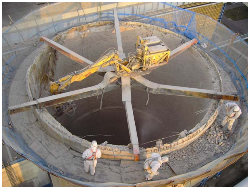
Rušenje na vrhu dimnjaka

i daljinskom upravljanju bagerom i njegovim alatima te pomoćnim radnicima koji su rezali armaturu i u unutrašnjost dimnjaka ubacivali preostali materijal.