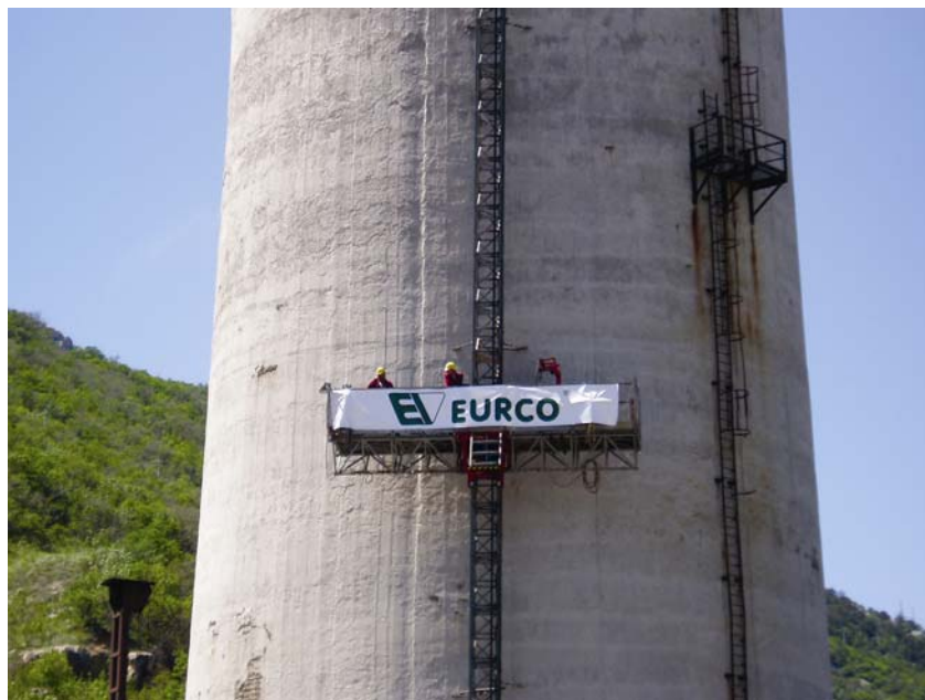
Podizanje radne platforme na vrh dimnjaka

strukture, naselja i mora. Osim toga takvo rušenje uzrokuje goleme oblake prašine i dinamička opterećenja na temeljno tlo koja mogu uzrokovati određena pomicanja. Stoga je odabrana tehnologija strojnog uklanjanja s posebnom opremom prilagođenom rušenju armiranobetonskih konstrukcija i izrazito visokih građevina koja je prvi put primijenjena u Hrvatskoj. U Europi se takva tehnolo-