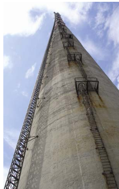
Dimnjak s ugladenim čeličnim tornjem

Početkom 2005. raspisan je natječaj za uklanjanje dimnjaka, a potreban je novac osiguralo Ministarstvo gospodarstva, rada i poduzetništva. Na natječaju je kao najpovoljniji prihvaćen projekt tvrtke Eurco iz Vinkovaca, našega najrenomiranijega i najopremljenijega dioničkog društva za razgradnju i uklanjanje starih i oštećenih građevina te saniranje zagađenih površina. Iako se slične visoke građevine u svijetu ruše eksplozivom, to u ovom slučaju nije dolazilo u obzir zbog blizine rafinerije, infras-