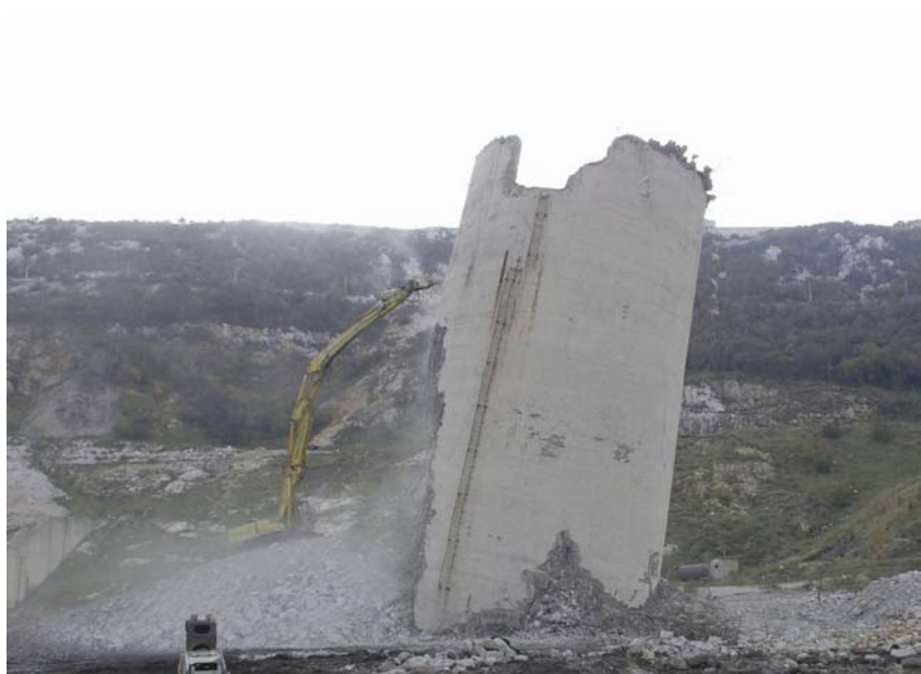
Rušenje ostataka dimnjaka s tla

U drugoj se fazi rušio unutarnji armiranobetonski plašt dimnjaka. Za to je bilo potrebno proširiti postojeći otvor u vanjskome omotaču i otvoriti još dva. Potom su u unutrašnjem plaštu također otvorene rupe koje su se sukcesivno proširivale u skladu s očekivanim smjerom urušavanja. Ba-