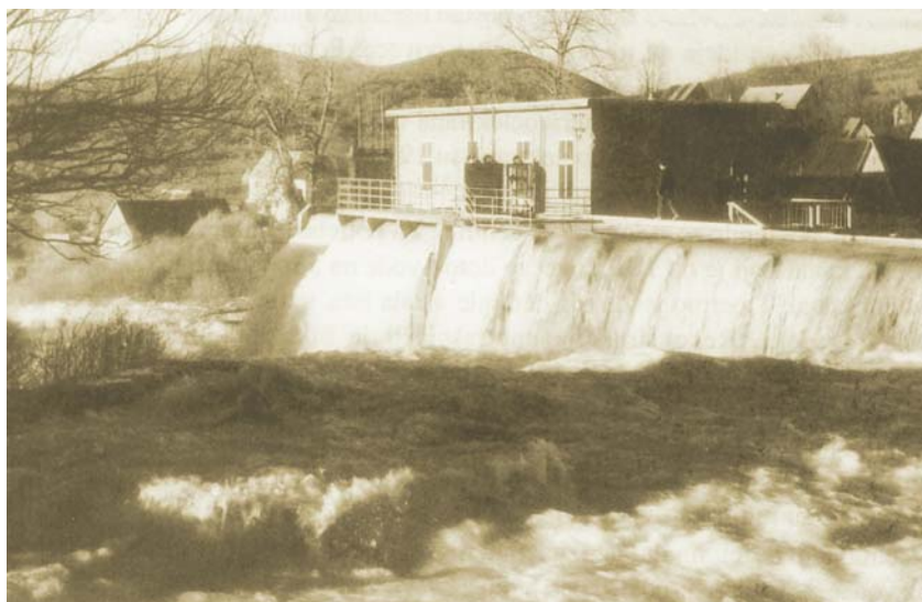
HE Švica nakon obnove 1952.

Za gradnju hidroelektrane utemeljeno je posebno društvo koje je započelo s mjerenjima protoka, trajanja pojedinih njegovih vrijednosti i međusobnih visinskih omjera, a istodobno je obavilo uvid u vlasništvo pojedinih zemljišnih čestica. S tim se poslom vrlo ozbiljno započelo 1908. godine, a potom se povremeno zastajalo i nastavljalo. Pripreme je značajno otežao Prvi svjetski rat, ali su nastavljene 1919. Bilo je mnogo sporova vezanih uz vlasništvo zem-