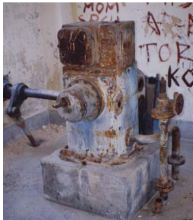
Generator koji je bio u uporabi od 1937. do 1961.

brzo. Nije građen poseban dovodni kanal, a ugrađene su dvije turbine tipa Francis (snage 105 KS) te trofazni generator 100 kVA, uz napon od 400 V i 50 Hz. Hidroelektrana je iskorištavala vodu protoka 1,19 m 3 /s, na isti način kao negdašnji mlin i pilana.