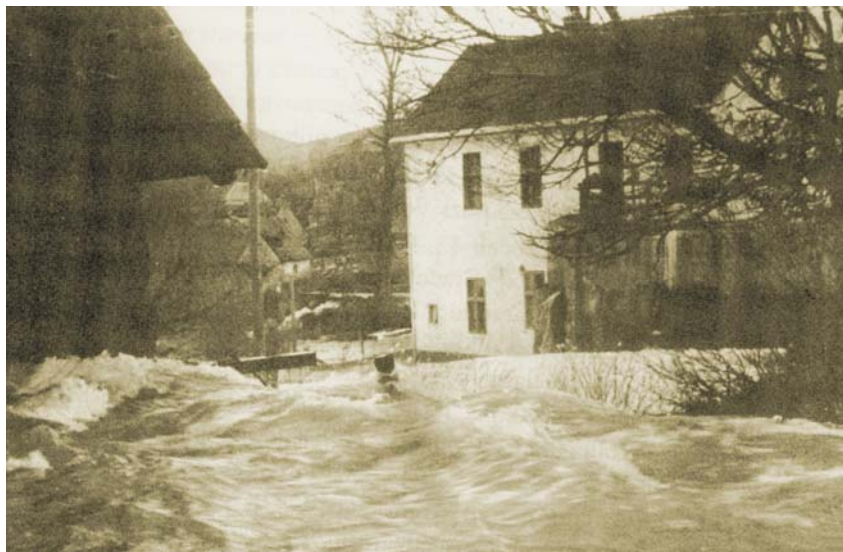
Pogled na zgradu HE Švica 1935.

hidroelektrane. Valja reći da Gacka u nastavku svog toka ponire, a njezine se vode kao estavele (povremeni krški ponori i izvori) pojavljuju u Hrvatskome primorju oko Jurjeva.