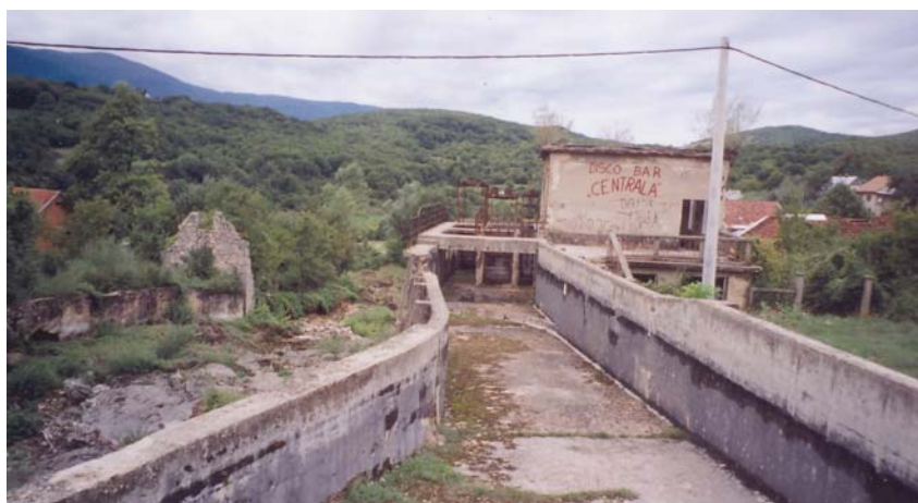
Sadašnji ostaci HE Švica

ljišta i iskorištavanje vodnog dobra, ali i sukoba vanjskih i domaćih koncesionara, pa je sve to ometalo i koncepciju hidroelektrane i početak njezine izgradnje.