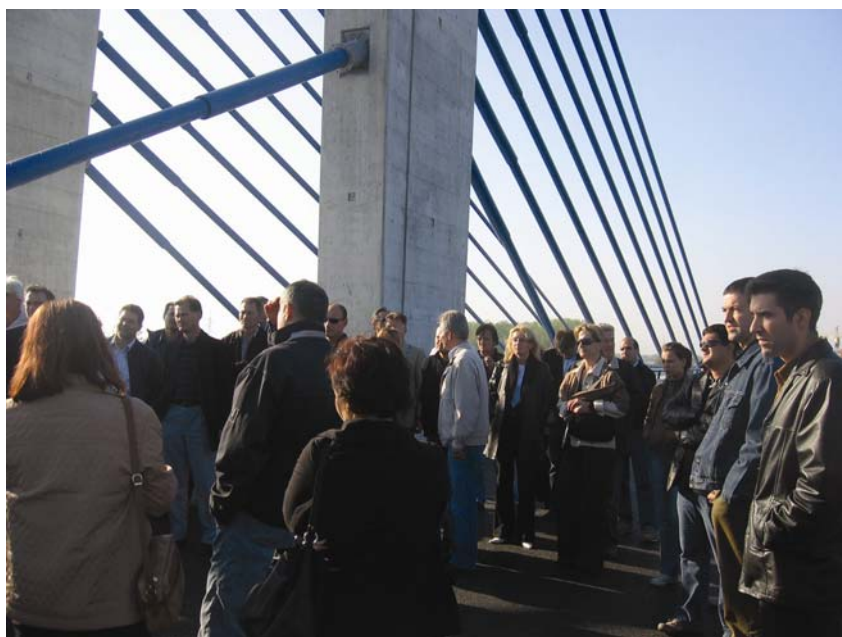
Sudionici godišnjeg stručnog seminara za posjeta Domovinskom mostu

Društvo građevinskih inženjera Zagreba organiziralo je od 25. do 29. listopada 2006. svoje drugo ovogodišnje stručno putovanje u inozemstvo. Cilj je putovanja bio Portugal i uz obilazak graditeljskih znamenitosti posjet sajmu Concreta 2006 u Portu.