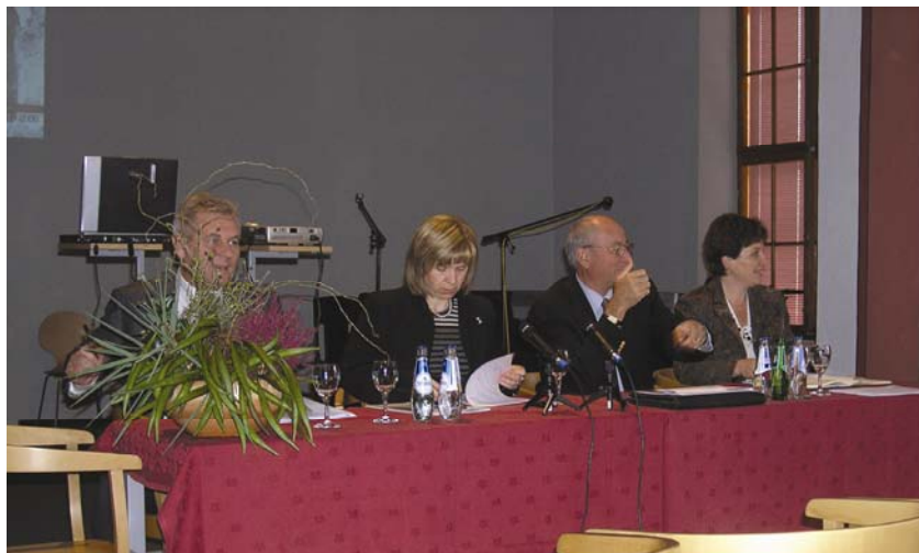
Radno Predsjedništvo proširene sjednice Predsjedništva HSGI-a