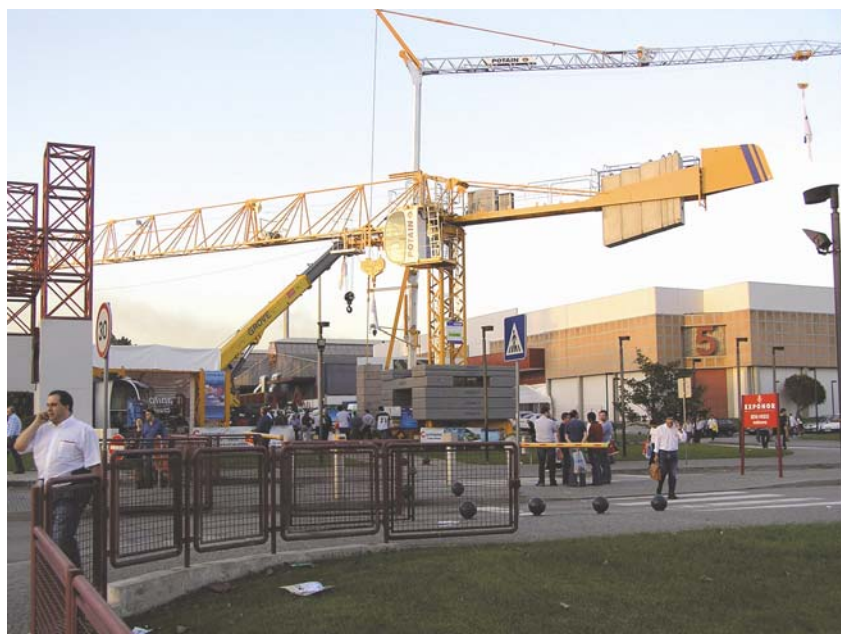
Međunarodna izložba graditeljske industrije Concreta 2006 . u Portu u Portugalu

Na najvećoj portugalskoj graditeljskoj izložbi posebna je pozornost bila posvećena inženjerstvu, održivosti i certifikaciji te sigurnosti i ekološkim materijalima. Tako se sajam udružio s udruženjem za razvoj kuće budućnosti ( AverioDomus )