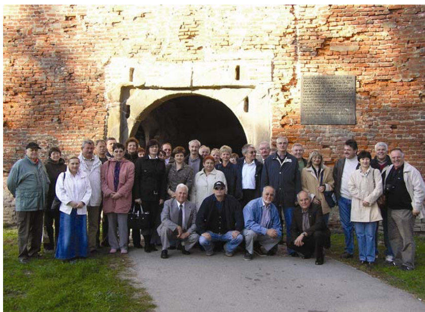
Sudionici proslave ispred čakovečkog Starog grada