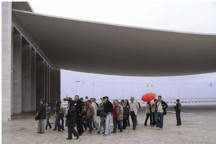
Sudionici stručnog putovanja na ulasku u Expo 1998. u Lisabonu

Nakon trosatnog leta do Lisabona obišlo se područje velike svjetske izložbe Expo 1998 , na kojoj su zapažen uspjeh imali i hrvatski graditelji s hrvatskim nacionalnim izložbenim paviljonom. Nažalost, iako su mnogi paviljoni prenamijenjeni u javne prostore (veliki oceanarij, casino, trgovački centri...), hrvatski je paviljon ipak srušen. Prvi je dan posjeta Lisabonu zaključen posjetom crkvi i samostanu Sv. Jeronima te slušanjem tradicionalne portugalske glazbe ( fado ) u jednom od brojnih restorana.