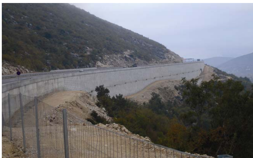
Zid od armirane zemlje Strikići na autocesti Zagreb – Split – Dubrovnik