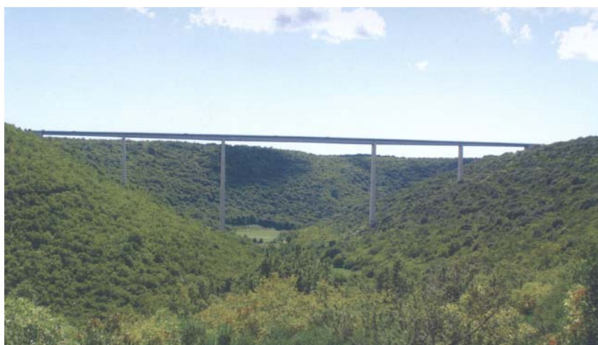
Vijadukt preko Limske drage

kod Zaprešića (ukupne duljine 1072 m). Viadukt gradi brojne prometne građevine i križanja u više razina, a grade i dva velika čvorišta u Zaprešiću i Jankomiru.