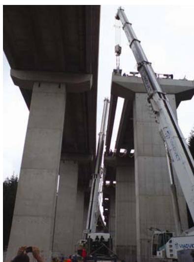
Izvedba drugog kraka vijadukta Golubinjak na autocesti Rijeka - Zagreb