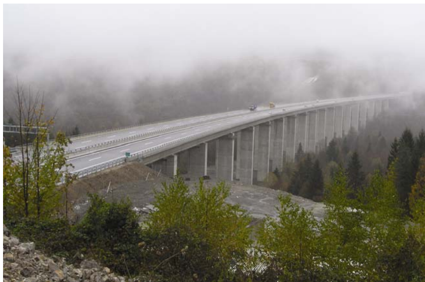
Cjeloviti vijadukt Zečeve drage u prometu

Viadukt je uključen i u gradnju autoceste A 1 od Zagreba do Splita. Tako je tijekom 2002. i 2003. gradio dionicu od čvorišta Sveti Rok do