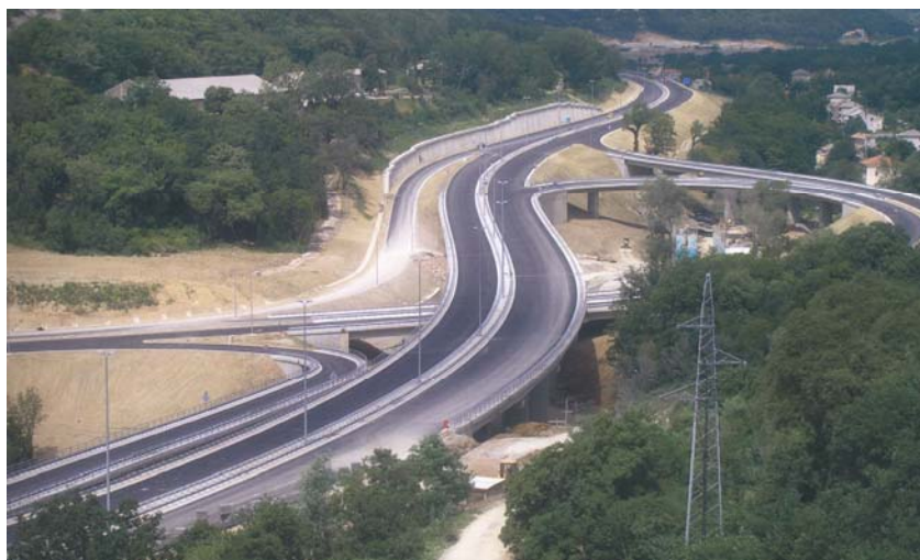
Čvorište Draga u Rijeci

Od poslova što ih je Viadukt izveo za grad Zagreb, svakako valja na-