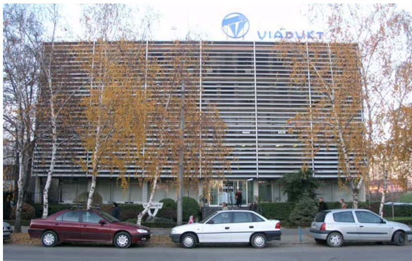
Upravna zgrada Viadukta

Iskoristili smo priliku da ukratko pričamo s predsjednikom. Na pitanje kako tumači činjenicu da je Viadukt iz teških vremena privatizacije izišao relativno neokrnjeno i bez znatnih smanjivanja kapaciteta, rekao nam je kako se pretvorba i privatizacija temeljile na ukupnom broju zaposlenih i kako je to jedan od rijetkih dobrih primjera cijeloga tog procesa u Hrvatskoj. Viadukt je u većinskom vlasništvu svojih sadašnjih i bivših zaposlenih i upravo je to dobrim dijelom pridonijelo očuvanju tvrtke u ratnim i poratnim vremenima. Ori-