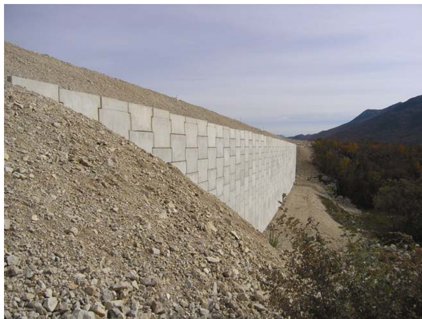
Jedan od izgrađenih zidova od armirane zemlje

je takva izvedba znatno jednostavnija i brža od klasičnoga potpornog zida te ujedno mnogo jeftinija.