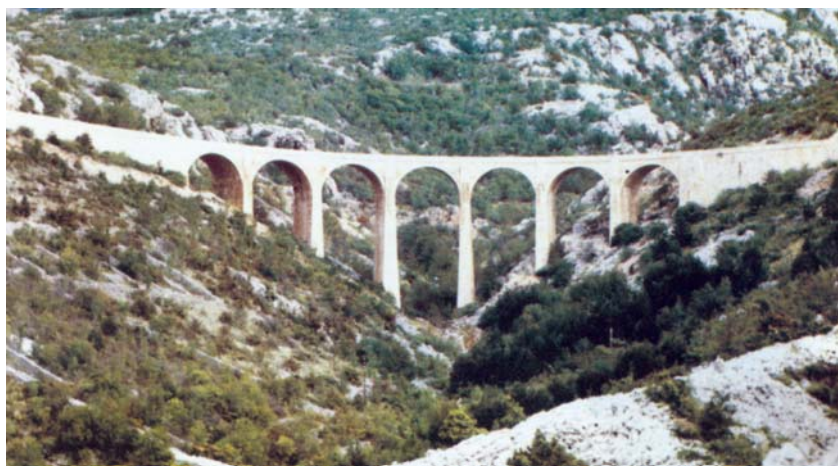
Kameni most pokraj Starigrada na Jadranskoj magistrali