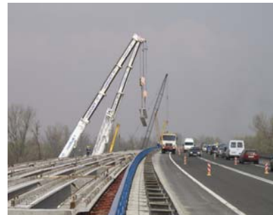
Gradnja drugog kraka mosta preko Save u Jankomiru na zagrebačkoj obilaznici

vesti novi Jankomirski most (365,55 m) na zapadnom ulazu u grad preko Save te rekonstrukciju Zagrebačke avenije u duljini od 5000 m. Svi su ti radovi izvedeni 2006. godine.