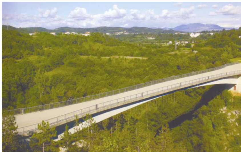
Pješački most preko Pazinske jame

nica iz pravca Rijeke, ali je bilo odgođeno njihovo puštanje u promet. Tako su poddionice Oštrovica – Vrata (12,4 km) i Vrata – Delnice (8,9 km) puštene u promet 1996., a Delnice – Kupjak (7,9 km) 1997. godine.