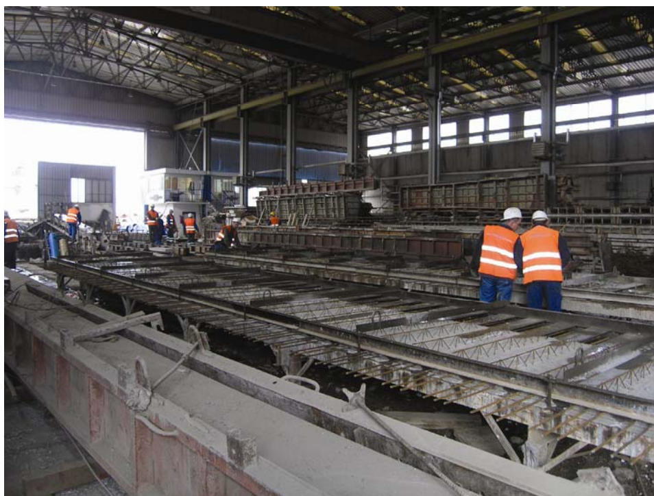
Hala za prednapinjanje armiranobetonskih nosača

Jednu smo specifičnost Viadukta ipak posebno izdvojili. Riječ je tvornici za industrijsku proizvodnju prednapetih, armiranobetonskih i betonskih proizvoda u Pojatnom nedaleko