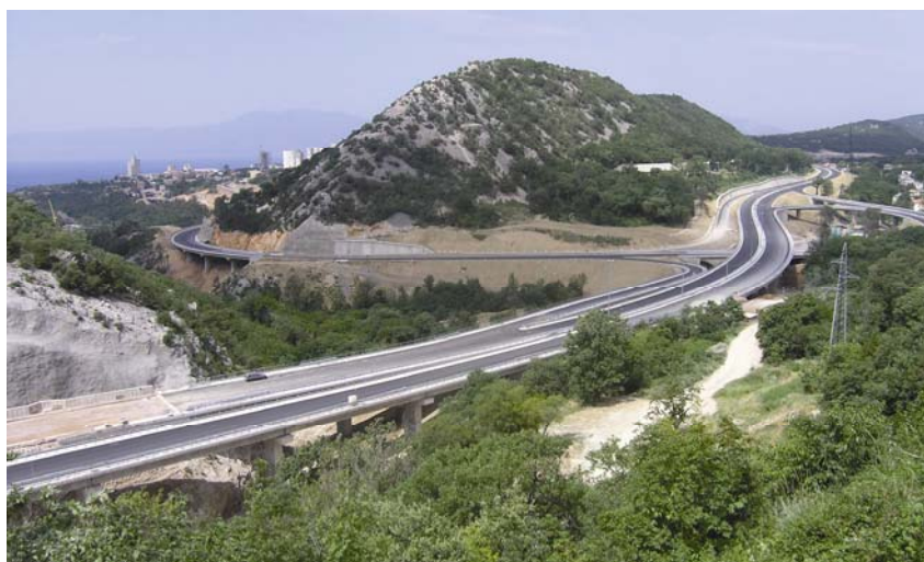
Pogled na dio riječke obilaznice

vesti novi Jankomirski most (365,55 m) na zapadnom ulazu u grad preko Save te rekonstrukciju Zagrebačke avenije u duljini od 5000 m. Svi su ti radovi izvedeni 2006. godine.