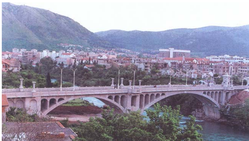
Carinski most u Mostaru

U međuvremenu se u punom profilu autoceste gradi i dionica Karlovac – Bosiljevo na autocesti prema Rijeci i Splitu. Na poddionici Karlovac – Vukova Gorica, dugoj 18,2 km i puštenoj u promet 2001., Viadukt je izgradio sve rigole, 14 km asfalta i