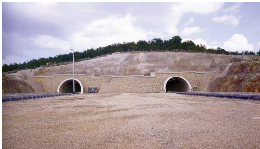
Portali tunela Dubrave na autocesti Zagreb – Split