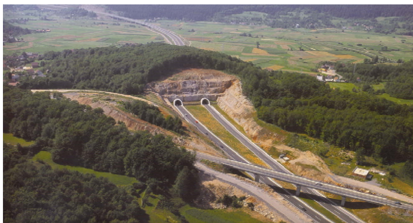
Tunel Brezik na autocesti Zagreb - Split

nel Dubrava (837,56 m + 868,56 m), a na dionici Prgomet – Dugopolje tri vijadukta od kojih je najveći Gajine (318,51 m). U tom istom razdoblju probija na dionici Dugopolje – Šestanovac i tunel Zaranač (329,9 m + 333,6 m). Nakon puštanja u rad dijela autoceste između Vrpolja i Dugopolja 2005. Viadukt gradi i 5 km trase na dionici Dugopolje – Šestanovac te vijadukte Biakuše (326 m) i Prosika. Kao prvi u Hrvatskoj radi i zidove od armiranog tla na mjestima prije planiranih vijadukata Ercegovići i Strikići.