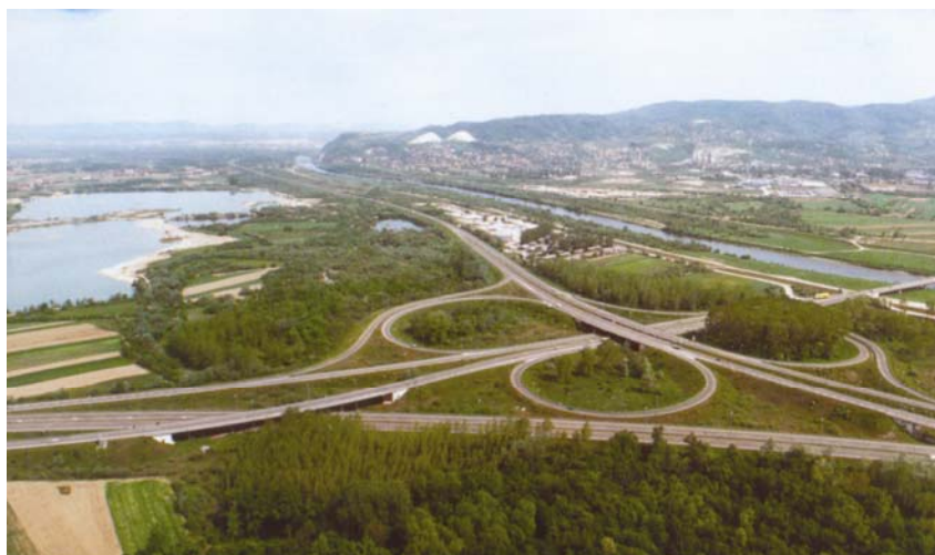
Zagrebačka obilaznica u Jankomiru

Grade se i neke visoke zgrade i obavlja temeljenja velikih industrijskih pogona u Zagrebu, Sisku i dr.