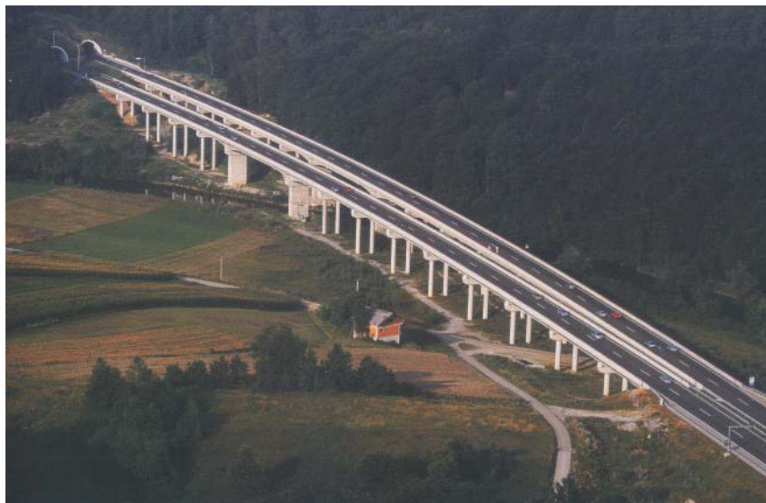
Vijadukt Dobra na autocesti Rijeka - Zagreb

najduljega vijadukta na trasi između Rijeke i Bosiljeva (940 m), građenog postupnim naguravanjem. Poslije su, u sklopu gradnje punog profila autoceste na tim vijaduktima izgrađeni drugi vozni trakovi i pušteni u promet u ljeto 2007. Na susjednoj je dionici Kupjak – Vrbovsko Viadukt je 2002. probio prvu cijev tunela Čardak (601 m), a poslije je s Hidroelekrom sudjelovalo u probijanju druge cijevi tunela Veliki Gložac (1126 m) na dionici Vrbovsko – Bosiljevo.