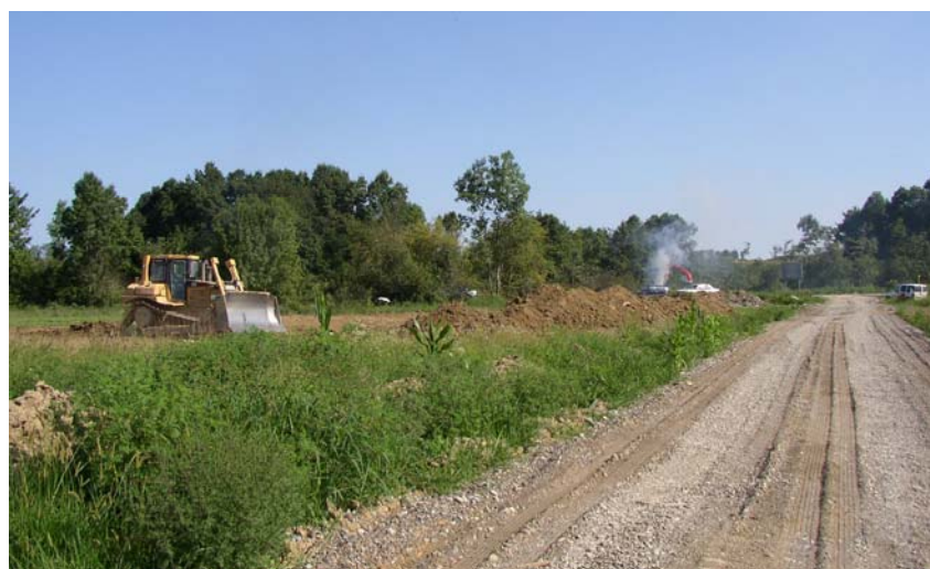
Početak radova na autocesti Beli Manastir – Osijek - Svilaj

mačina da se radi o jednoj od najljepših autocesta u Hrvatskoj. Iako u ravnicima, autocesta zbog brojnih zavoja i prometnih građevina nije uopće dosadna. Nesumnjivoj ljepoti pridonoše i zeleni okoliš te pažljivo uređeni i betonskim pločama obloženi vodotoci.