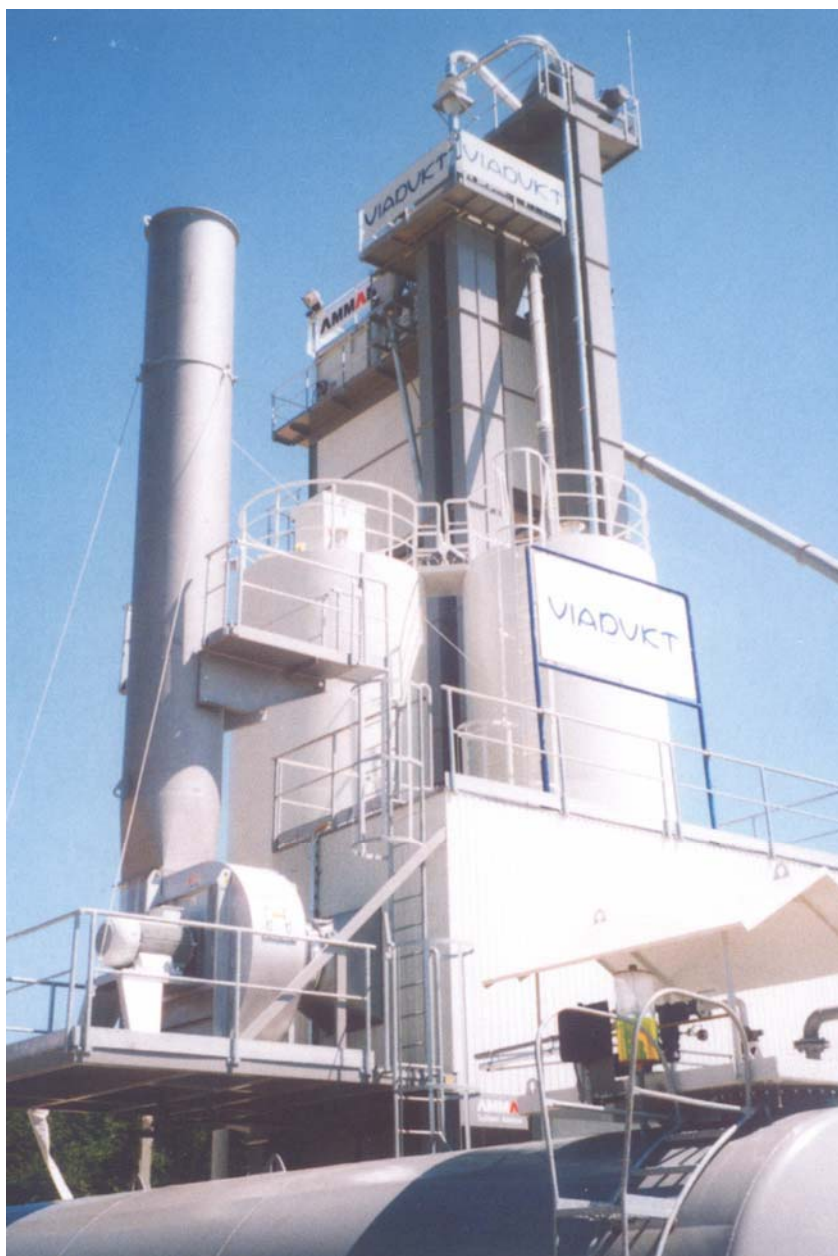
Dio postrojenja za proizvodnju asfalta

ličitim namjena, motorna vozila za prijevoz osoba, tereta i za specijalne namjene, ali i postrojenja za proizvodnju i ugradnju asfalta, betona, armiranobetonskih i betonskih elemenata te betonske galanterije. Od građevinske mehanizacije prema vrstama najviše je bagera (42) i valjaka (40), a slijede utovarivači (21),