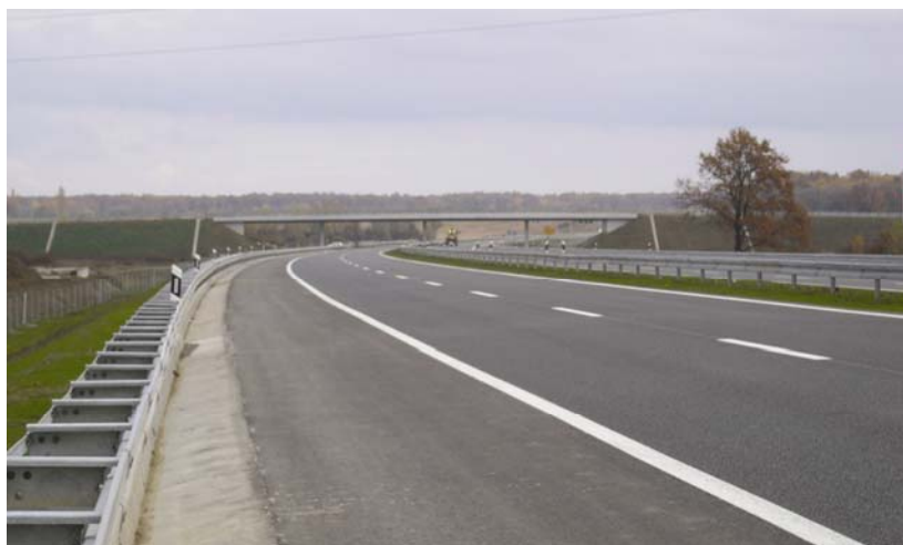
Trasa na dionici Đakovo – Sredanci autoceste Beli Manastir – Osijek - Svilaj

Provozili smo se cijelom duljinom trase i uvjerali se u tvrdnje našeg do-