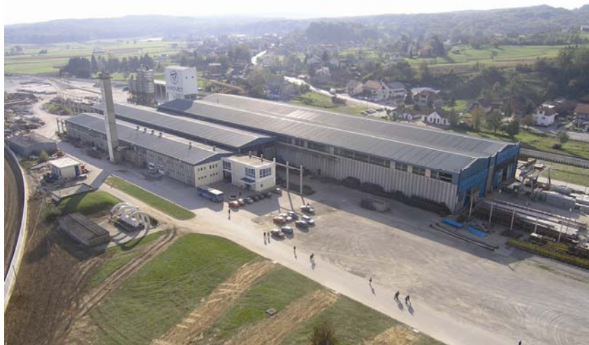
Pogled iz zraka na Tvornicu betonskih proizvoda u Pojatnom

Gradi se i nova brza cesta kroz Karlovac s velikim vijaduktom te cijeli niz brzih gradskih prometnica u Zagrebu, među kojima se ističe drugi trak ceste Zagreb – Velika Gorica (1982.). Na Kosovu i u Bosni i Hercegovini uglavnom se grade gradske prometnice u Prištini i Kosovskoj Mitrovici te Drvaru, Bosanskoj Krupi i Bihaću.