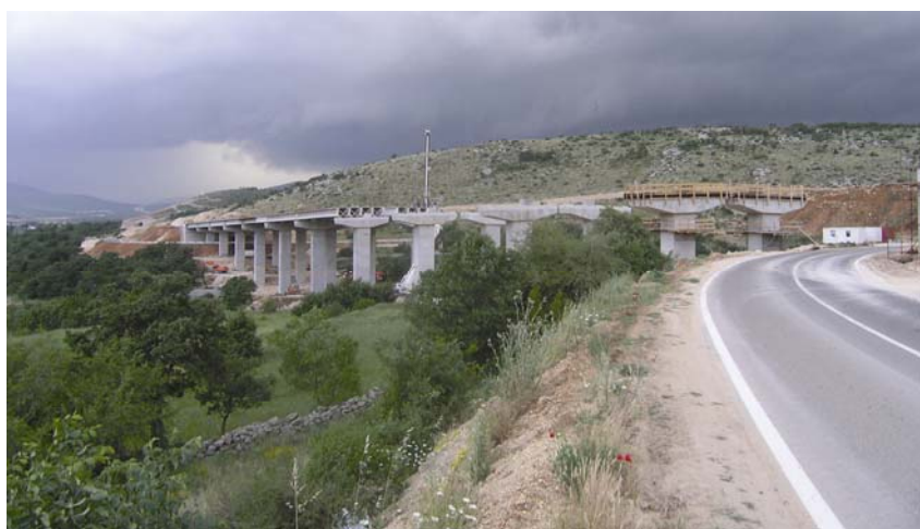
Gradnja vijadukta Biakuše na autocesti Zagreb – Split - Dubrovnik

Viadukt je kao podizvoditelj radio i na dionici Bregana – Zagreb na autocesti Bregana – Zagreb – Lipovac