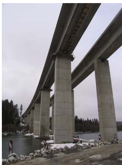
Pogled odozdo na most Bajer (drugi krak još nedovršen)

U projekt je uključeno 320 radnika svih profesija, pretežno dakako građevinskih, a smješteni su u Viaduktovoj bazi u Vratima i u Vrbovskom. Rade na dogradnji punog profila autoceste na dionici Oštrovica – Vrata i na dionici Vrata – Delnice gdje je Viadukt vodeći partner u poslovnoj udruzi. Prije su radili na dovršetku dionice Vrbovsko – Bosiljevo.