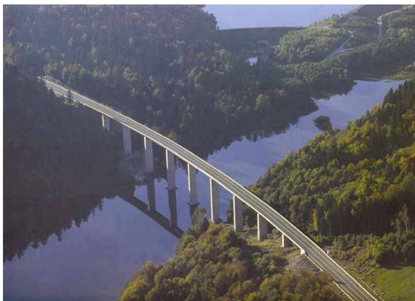
Jedan krak mosta Bajer na autocesti Rijeka - Zagreb

No ipak se ne prekida gradnja suvremenih autocesta i poluautocesta. Tako Viadukt nastavlja graditi autocestu kroz Zagorje prema Sloveniji. Već su 1991. s nešto smanjenim intenzitetom nastavljeni radovi na autocesti između Zagreba i Rijeke, na tzv. "snježnoj dionici" između Oštrovica i Delnica koja se gradi kao poluautocesta. Viadukt gradi tunele Sleme (830 m) i Vrata (257 m) te u suradnji s Hidroelektrinom Tuhobić (2141 m), najdulji tunel na trasi. Gradi i veliki vijadukt Bajer (520 m) na kojemu je prvi put u Hrvatskoj prednapeti rasponski sklop sandučastog presjeka izveden naguravanjem (1994.). Nastavljena je i gradnja drugih dio-