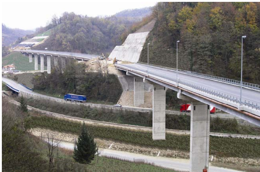
Vijadukt Puh i Ravnišćica na cesti Zagreb - Macelj

obilaznice. Tako su na Jadranskoj magistrali (cesta D8), na dionici Orehovica – Sveti Kuzam, izvedeni vijadukti Draga I (južni vijadukt 384,67 m, sjeverni vijadukt 304,99 m) i Kostrena (južni vijadukt 110 m, sjeverni 90 m). Na spojnoj cesti prema riječkoj luci (cesta D404) izvedeni su vijadukti Martinšćica III (178,8 m) i Bobova (139,6 m). Svi su radovi izvedeni tijekom 2005. i 2006., a na cesti D404 trebalo je zbog blizine vodocrpilišta poštovati stroge ekološke zahtjeve.