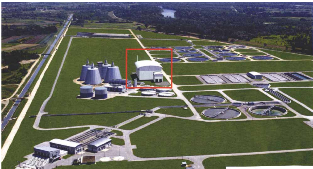
Slika 5. Pogled na CUPOVZ s označenim dijelom prostora za termičku obradu mulja

o monotermskoj obradi mulja. Studija o monotermskoj obradi mulja obuhvaća sve nužne radove za izgradnju postrojenja, uključivo i dodatne radove za zaštitu okoliša [25]. Monospalionica bila bi locirana u neposrednoj blizini objekata za stabilizaciju i odvodnjavanje mulja, slika 5. Vrijeme za izradu projekata, ishodenje potrebnih dozvola te izvedba građevinskih, strojarskih i elektrotehničkih radova, okvirno bi trebalo četiri godine. Kako dosad još nije donesena odluka o konačnom gospodarenju muljem, lako se može utvrditi da u