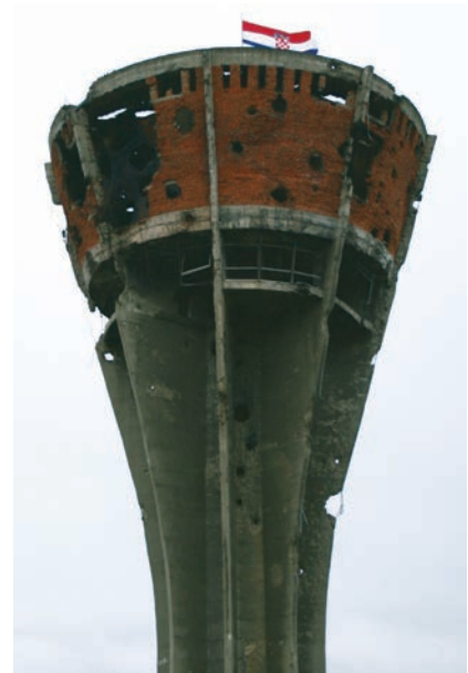
Slavni Vodotoranj s više od 600 oštećenja