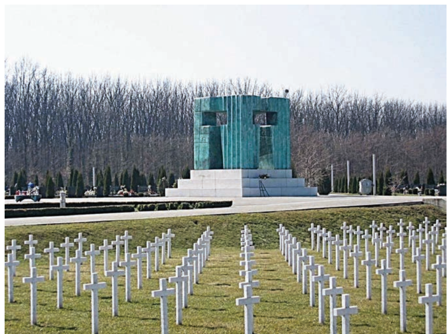
Memorijalno groblje Domovinskog rata s 938 bijelih križeva

Memorijalni centar predstavlja posjetiteljima i sve ostale sadržaje i obilježja Domovinskog rata u Vukovaru poput budućega Doma ratnika i križa na Lužcu, spomen-obilježja u Bogdanovcima, Kukuruznog puta, Sotin-Skendra i masovne grobnice Nova ulica te spomenika