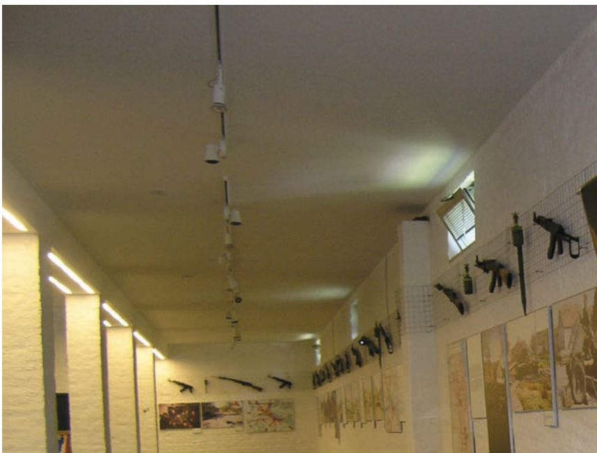
Izložba ručnog oružja i fotografija

Novi hostel u Memorijalnom centru dobit će ime Dubrovnik jer je u Borovu naselju negdašnji samački hotel, a poslije i privremeni smještaj za ljude pogođene poplavom iz županjske Posavine, prenamijenjen u drugi hostel (s 240 soba) u sklopu Memorijalnog centra. Dobio je ime Zagreb u znak zahvalnosti gradu iz kojeg su stigli brojni vukovarski branitelji, ali i na pomoći u uređivanju brojnih spomen-obilježja, primjerice Ovčare . Uostalom, temeljito preuređenje hostela Grad Zagreb namjerava obaviti u 2016. godini. Preuzimanje i "krštenje" hostela svečano je obilježeno početkom studenoga 2015., nakon čega je gradonačelnik Zagreba Milan Bandić bio gost-predavač u Školi mira.