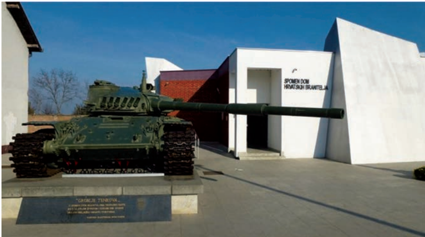
Spomen-dom hrvatskih branitelja na Trpinjskoj cesti