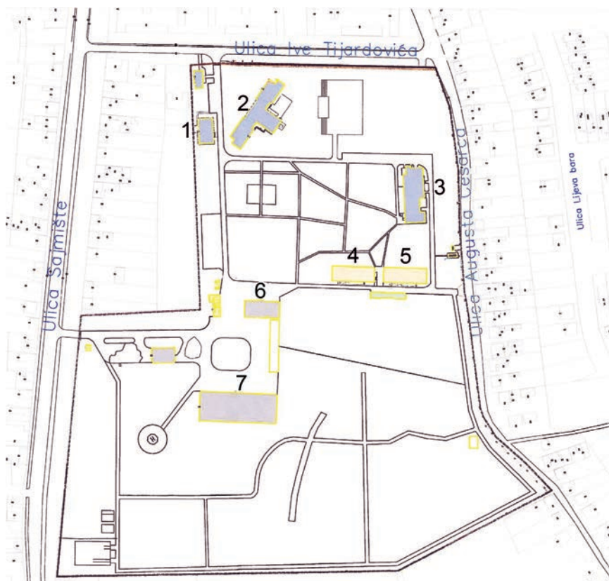
Prikaz sadržaja Memorijalnog centra (1 – upravna zgrada, 2 – hostel, 3 – restoran, 4 – fotografije u Domovinskom ratu, 5 – umjetnost u Domovinskom ratu, 6 – izložbeni prostor hangar, 7 – hangar s nadstrešnicom)

dvanaestorici hrvatskih policajaca u Borovu Selu. Najpoznatiji su ipak Središnji križ na utoku Vuke u Dunav (visok 9,5 m i težak 40 tona, dar Hrvatske ratne mornarice iz Pule, čiji je autor kipar Šime Vidulin), vukovarska bolnica kao mjesto sjećanja u čijem je podrumu vjerno prikazan život ranjenika i bolničkog osoblja tijekom opsade i slavni Vodotoranj, simbol vukovarskih stradanja i pobjede, ali i ostvarenja naših graditelja (visok 50,3 m i opsega 2200 m 3 ), čija se obnova godinama najavljuje. Vodotoranj je izgrađen krajem 1968. i bio je jedna od najvećih takvih građevina u Europi. Na njegovu se vrhu nalazio restoran s vidikovcem. Projektirali su ga Aleksander Rose i prof. dr. sc. Matej Meštrić. Tijekom srpske agresije na Vukovar bio je jedna od najčešćih meta neprijateljskog topništva pa je zadobio više od 600 oštećenja. Dio je Memorijalnog centra i Memorijalno groblje žrtava iz Domovinskog rata, jedna od najvećih masovnih grobnica u Europi na-