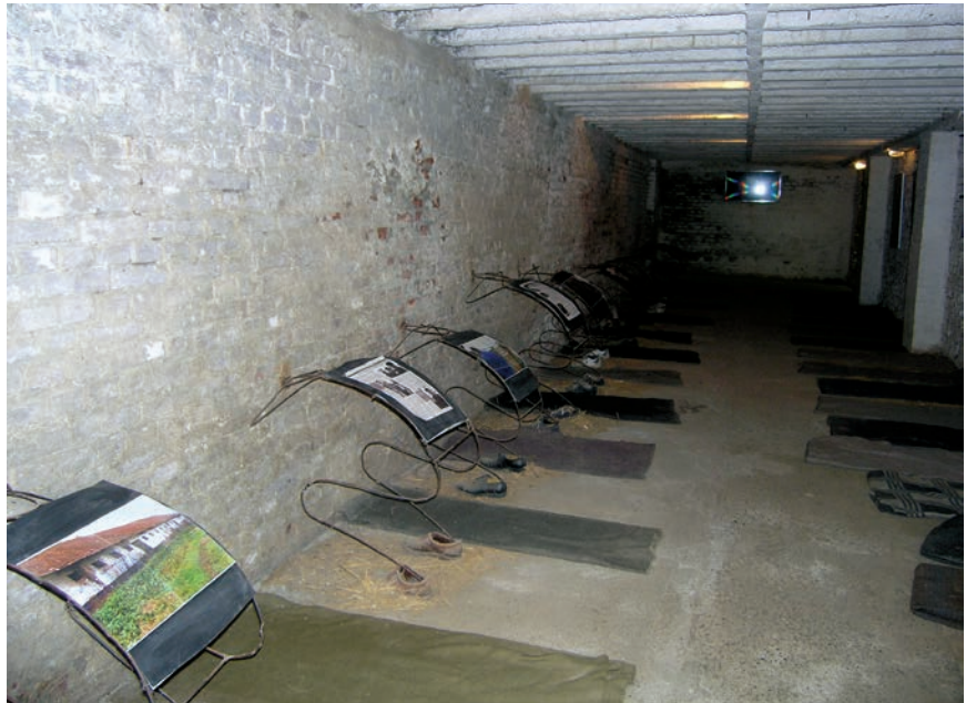
Prikaz logora Stajićevo