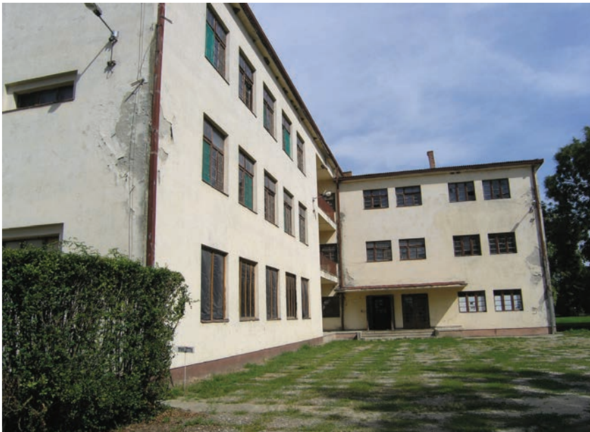
Zgrada koja će se prenamijeniti u hostel