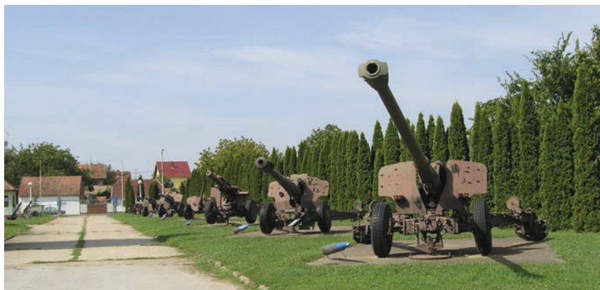
Posloženi topovi u nizu

Potpuno se obnavlja i postojeći restoran s kuhinjom, čija neto površina iznosi 527,61 m 2 , a ugovorena je vrijednost radova 5,7 milijuna kuna. I na toj se građevini radi poboljšanja fizikalnih svojstava mijenjaju vrata i prozori te fasadna obloga (također sustav etics ). Mijenjaju se i sve podne obloge, uključujući i obloge u kuhinji u prizemlju, dok će se u restoranu zadržati postojeći i očuvani teraco pod.