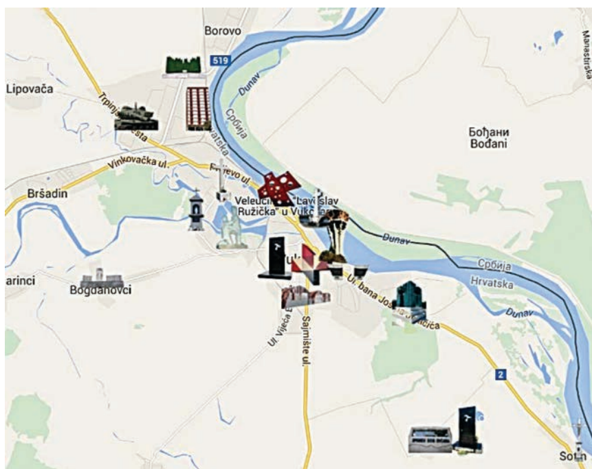
Sva obilježja Domovinskog rata u Vukovaru i okolici o kojima brine Memorijalni centar

vojarnu, uglavnom se vodila briga samo o njezinu održavanju. Naime, vojarna se nalazi u gradu i u blizini nema vojno vježbalište pa nije pogodna za smještaj postrojbe. Još je 1996., prema dugoročnom planu razvoja OSRH-a, bilo ustrojeno Povjerenstvo za izradu programa ustrojbe posebnoga memorijalno-edukacijskog centra, na čijem je čelu bio general-pukovnik Slavko Barič, sadašnji ravnatelj Hrvatskoga vojnog učilišta. Upravo je to povjerenstvo 2007. obznanilo da vukovarska vojarna bez posebne namjene postaje Memorijalni, informacijski, dokumentacijski i edukativni centar Domovinskog rata (ne treba ga miješati s Hrvatskim memorijalno-dokumentacijskim centrom Domovinskoga rata koji od 2005. djeluje u zgradi Hrvatskoga državnog arhiva u Zagrebu). Namjera je bila omogućiti svim vojnim i civilnim posjetiteljima da na jednome mjestu dobiju cjelovit uvid u Domovinski rat. Centar je