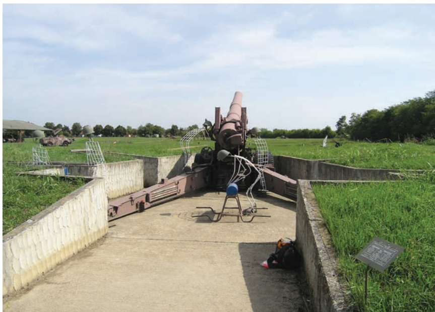
Detalj simulacije bojnog polja pod nazivom: Ojačana brigada u obrani

Na glavnom se ulazu planira podizanje terena kako bi se osobama s invaliditetom omogućio jednostavniji prilaz. Prostor će zadržati prijašnji oblik i namjenu, ali se prilagođuje novome poslovanju. Znatno će biti poboljšana kvaliteta kuhinjske tehnologije i restorana, posebno linije posluživanja, ali i garderobe za osoblje i sanitarija za posjetitelje.