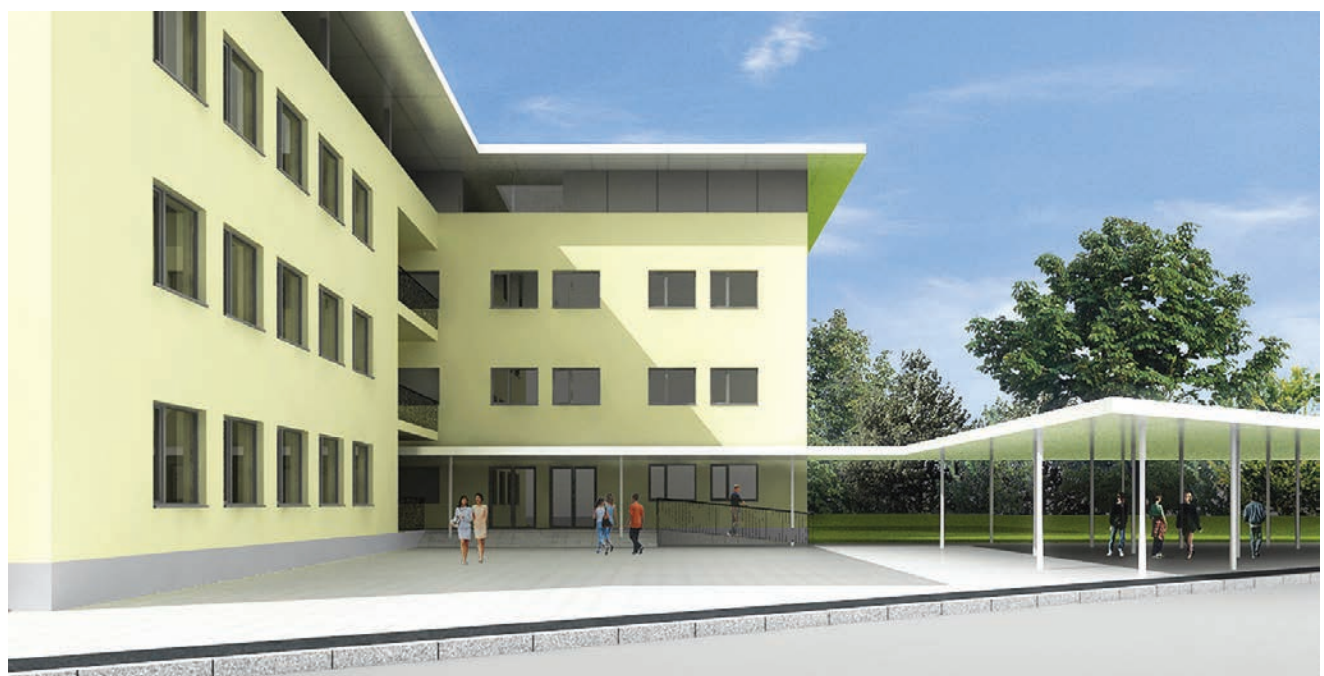
Budući izgled hostela

Upravna se zgrada nalazi odmah do portirnice i u cijelosti je preuređena, a izvođač je bio Vodotoranj d.o.o. iz Vukovara. Nova neto površina nakon svih promjena, rušenja i pregradnji iznosi 393,17 m 2 , a vrijednost je svih radova 2,65 milijuna kuna. Radi poboljšanja fizikalnih svojstava zgrade promijenjeni su postojeći prozori i vrata, ali i pročelja koja sada imaju bolja izolacijska svojstva (sustav etics ). Zamijenjene su i završne obloge podova, a u prizemlju su promijenjeni svi postojeći slojevi radi boljih fizikalnih svojstava, ali i ugodnijeg i sigurnijeg boravka. Dakle, upravna je zgrada preuređena bez ikakvih promjena u vanjskome obliku ili u volumenu i bez zadiranja u stabilnost. Budući da je odlučeno da će svaka građevina u Memorijalnome centru dobiti naziv prema jednom od gradova u kojima