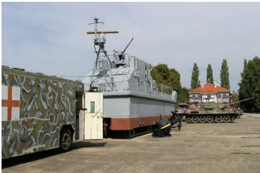
Dio vojne opreme na otvorenom

su se vodile ključne bitke u Domovinskoj ratu, upravna je zgrada dobila naziv Šibenik .