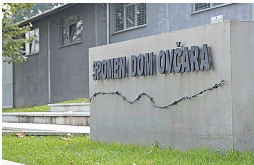
Ulaz u Spomen-dom Ovčara

namijenjen i pripadnicima braniteljskih udruga i hrvatskim braniteljima, ali i đacima, studentima i svima onima koji su zainteresirani za istraživanje ratnih zbivanja u Hrvatskoj krajem prošlog stoljeća. Razradi te ideje pristupilo se odmah pa je vrlo brzo taj muzejski prostor koji je vodio brigadir Petar Čavar znalo posjetiti i do 15.000 ljudi na godinu. Zabilježen je i velik broj posjetitelja iz inozemstva, a u obilazak su dolazili i polaznici Američke ratne škole.