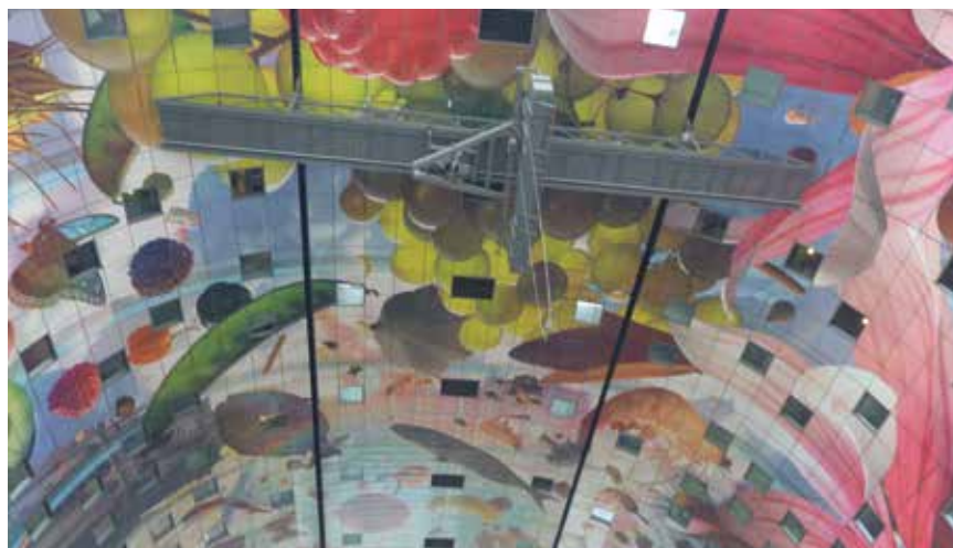
Na živopisnom stropu tržnice nalaze se i prozori stanova

loj širini jedinice, a 24 penthouse na vrhu zgrade imaju, zahvaljujući obliku luka, vrlo široke terase. Penthouse je stan koji se nalazi na vrhu stambene zgrade, a zauzima cijelu površinu kata. Polovica stanova ima prozore koji gledaju na tržnicu. Ti su prozori trostruko ostakljeni kako bi se izbjegao prodor neugodnih zvukova ili mirisa s tržnice. Širok je i izbor veličina stanova, od 80 do 300 m 2 . Penthouse imaju svoje ulaze na desetome katu i unutarnje stubište te prostor za dizala na jedanaestome katu. Zbog toga je luk Markthala mogao biti izveden bez kutija za dizala na krovu. Čitav je projekt stajao 175 milijuna eura, što se isplatilo jer je tržnica Markthal golemi svjetski hit. Na njezinu otvorenju bila je i nizozemska kraljica Maxima, a i turizam je u Rotterdamu porastao upravo zbog tog projekta. Svi su stanovi prodani, uključujući i vrlo skupe penthouse , koji su koštali više od milijun funti.