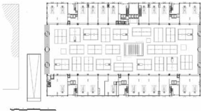
Tlocrt tipičnog kata

U listopadu 2004. tim tvrtke MVRDV pobijedio je na natječaju u organizaciji Grada Rotterdama za projektiranje i izgradnju tržišne dvorane u središtu Binnenrotta. Grad je želio produžiti postojeću otvorenu tržnicu s natkrivenim dijelom. Prema strožim europskim pravilima, u budućnosti otvorena prodaja svježe i ohlađene hrane više neće biti dopuštena. Osim toga, općina je željela povećati broj stanovnika u središtu grada kako bi se stvorilo više kapaciteta za usluge u tome području. Program natječaja – stanovanje, parking i tržnica – tražio je očigledno rješenje: dva stambena elementa između kojih će se nalaziti ekonomski konstruirana tržnica. Osim toga prostor je zahtijevao visoku zgradu, javnosti sasvim otvorenu i dostupnu. Stvorena je velika dvorana sa dva široka otvora prema gradu. Kako bi izgradnja bila učinkovitija, izabrana je krivulja koja ulazi u tradicionalnu jezgru grada. Dodavanjem nekih prostora na niže katove za potrebe dodatnog višenamjenskog sadržaja nastao je luk dug 120 metara, širok 70 metara i visok 40 metara.