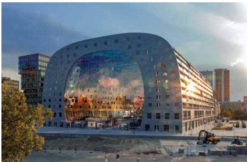
Markthal u vrijeme uređenja okolnog trga

Kako bi zatvaranje zgrade bilo što transparentnije, izabrana je fasada s mrežom kabela kojoj je potrebno vrlo malo konstruktivnih elementa