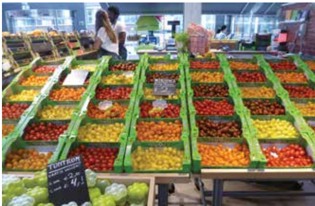
Dio gastronomske ponude na tržnici