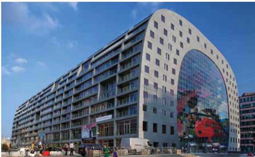
Bočno pročelje tržnice Markthal