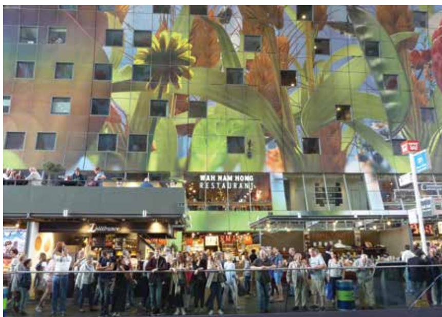
Pogled na unutrašnjost tržnice

Zgrada je ukorijenjena u povijest grada i nalazi se paralelno s Laurenskerkom (kasnosrednjovjekovnom crkvom Laurens), a na mjestu nekadašnjeg nasipa uz rijeku Rotte. Ta je rijeka preusmjerena krajem 19. stoljeća zbog željezničkog vijadukta koji vodi na južnu obalu rijeke Maas. Devedesetih godina prošlog stoljeća ta je linija obnovljena kao podzemni tunel. Ukapanjem željeznice nastao je duguljasti trg, idealan otvoren prostor za prodaju svježe hrane dva puta tjedno. Zgrade iz 1950. na obje su strane starog trga svojim stražnjim fasadama iznenada suočene s novim trgovom pa se one polako zamjenjuju.