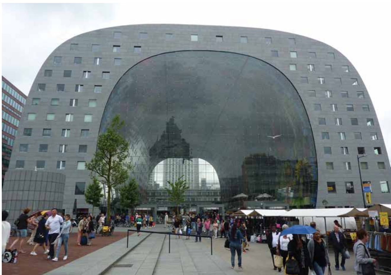
Ulazno pročelje tržnice Markthal

Krajem 2014. Rotterdam je dobio najnoviji urbani orijentir: Markthal Rotterdam – natkrivenu tržnicu, projekt tvrtke MVRDV