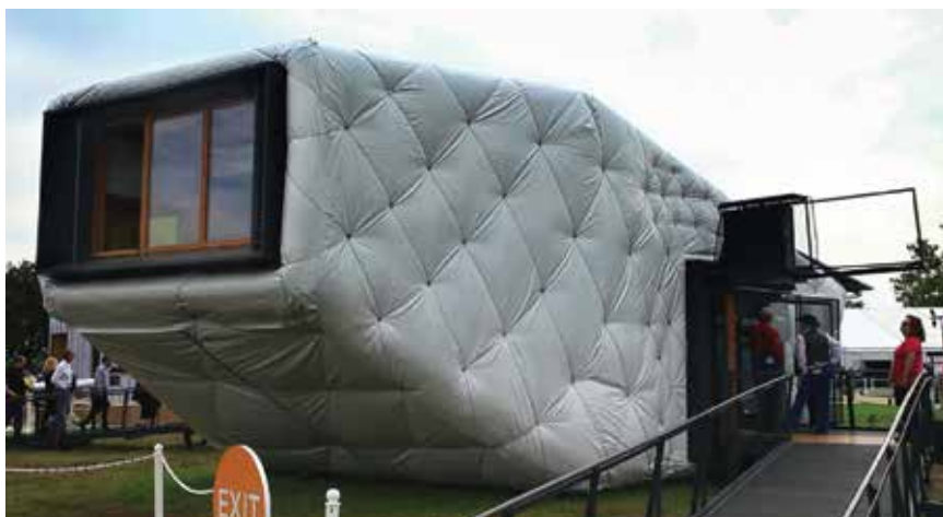
Pokušaj gradnje energetski učinkovite kuće jeftinim materijalima

Mogu li graditelji, proizvođači građevnog materijala, investitori, inženjeri-obrtnici koristiti poticaje za inovaciju ili ih smatraju preambicioznima i pokušavaju oslabiti. Predlažu li metode nacionalnog proračuna na temelju referentnih građevina, referentne klime, bruto površine i temperature od 19 °C bolju energetska učinkovitost od one koja već postoji u stvarnosti. Može li kratkoročni profit nadjačati našu odgovornost za održivost.