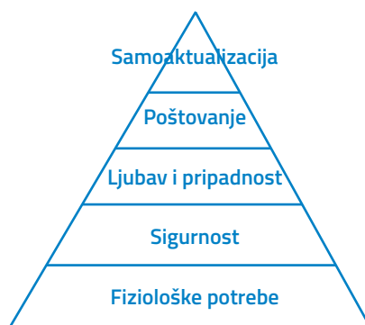
Hijerarhije potreba po Abrahamu Maslowu

Kada se netko tko već živi u luksuzu i uživa ugled želi hijerarhijski uspinjati, danas to postiže pokazivanjem socijalne odgovornosti i time stečenog višega društve-