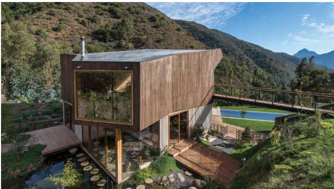
Kuća El Maqui u Čileu

U društvu su automobili mnogo više od sredstava koja jednostavno prevoze ljude. Ljudi se emocionalno vežu uz automobile, konstruktori ih vide kao umjetnička djela, a može se reći da su oni na-