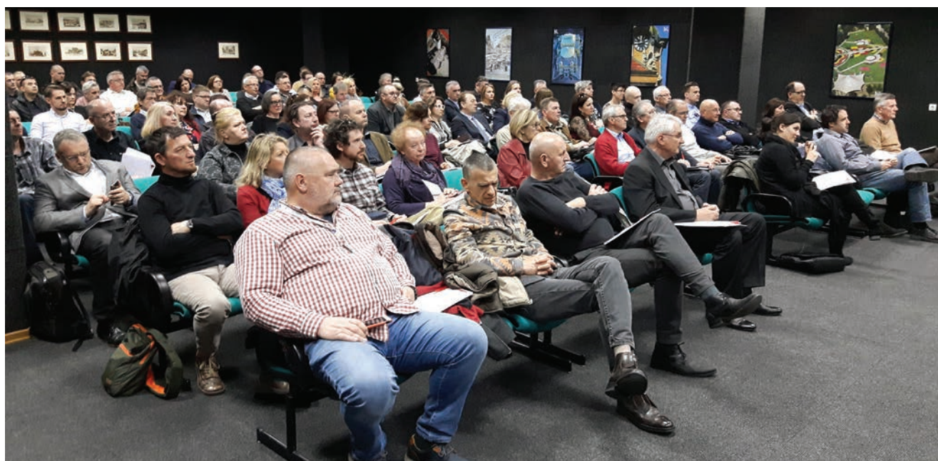
Sudionici seminara Hrvatske udruge za zaštitu od požara

Zbog potrebe za što većom fleksibilnošću prostora te za što većim upotrebljivim prostorom, za stambene etaže odabran je sustav nosivih vanjskih zidova, stupova i greda od CLT-a (križno-lameliranoga drveta). Kao toplinska izolacija koristi se drvena celuloza. Sustav ventilirane fasade s oblogom od pločastih materijala omogućuje slobodu u oblikovanju i pozicioniranju otvora. Jedan od suvremenih detalja oblikovanja jest i krovna ploha koja zadržava karakterističan dvostrešni oblik, ali se pokriva istim materijalima kao i vanjski zidovi. Upotrebom drveta kao osnovnoga konstruktivnog materijala omogućena je veća energetska učinkovitost u istoj de-