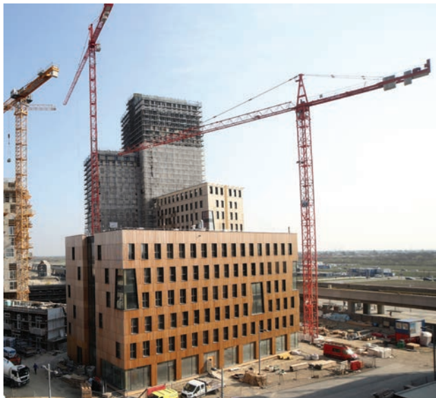
Izgradnja drvenog nebodera u Beču - projekt HoHo