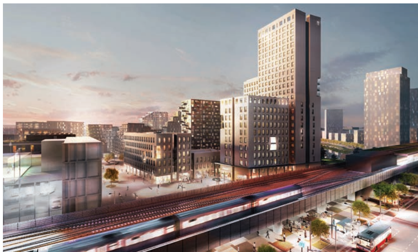
Projekt HoHo - vizualizacija

Sustav drvene konstrukcije omogućuje visoku učinkovitost u smislu toplinske izolacije i servisiranja. Drveni kompozitni podovi pričvršćeni su za središnje betonske nosive jezgre i protežu se do ruba zgrade. Te podne ploče podržavaju drveni sustav stupova oko obrisa zgrade, a ta konstrukcija podržava predgotovljene vanjske zidne module koji kombiniraju ploče od punoga drva sa zemljanom, betonskom ljuskom za oblikovanje fasade zgrade.