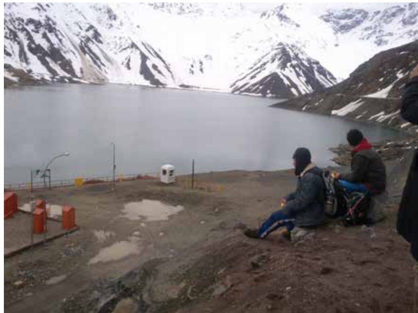
U kampu Aucayes je smješteno 2000 radnika i njihovih obitelji (lijevo), vodozahvat El Yeso na nadmorskoj visini od 2300 metara (desno)

Gradilište je smješteno 50 km jugoistočno od grada Santiaga de Chile, u visokome slivu rijeke Maipo, a obuhvat projekta prostire se na više od 30 km duljine te ga karakterizira i znatna visinska razlika