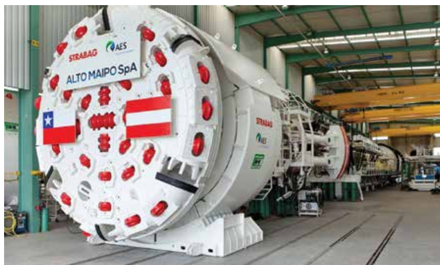
Tunelska bušilica T1 za bušenje tunela Las Lajas

Gradnja uključuje projektiranje i izgradnju 74 kilometra tunela, kaverni za strojnarnice, masivne zemljane radove, ostale građevinske radove te ugradnju elektromehaničke i hidrotehničke opreme hidroelektrana. Osnovna projektna dokumentacija koja je preuzeta od investitora u trenutku potpisivanja ugovora između investitora i izvođača bila je na razini tzv. gruboga glavnog projekta s izrazitim manjkom izvedenih geotehničkih bušotina i istražnih radova. Zbog toga je predviđeno to da će se odluke donositi na licu mjesta, jer se tek tijekom faze građenja mogu otkriti izazovi koji se nisu mogli predvidjeti u fazi projektiranja. Najzahtjevniji dio ovog projekta jest bušenje više od 70 kilometara tunela. Približno 40 km tunela buši se uz pomoć rotacijskih bušaćih strojeva TBS. Promjeri strojeva su različiti i veličina promjera rotacijske glave stroja iznosi 6,90 m kod