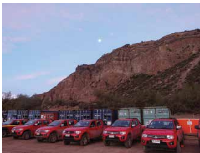
Glavno prijevozno sredstvo tzv. pick up

Cijelo područje projekta područje je aktivnih vulkana i sve prometnice koje se protežu područjem projekta imaju oznake za smjerove evakuacije do skloništa u slučaju aktiviranja vulkana. Gradilište je specifično i po znatnim razlikama u klimatskim uvjetima koji variraju od alpske klime kod izvorišta rijeke u naselju La Engorda do mediteranske klime kod izljeva tunela u kanjon rijeke kod mjesta El Canel.