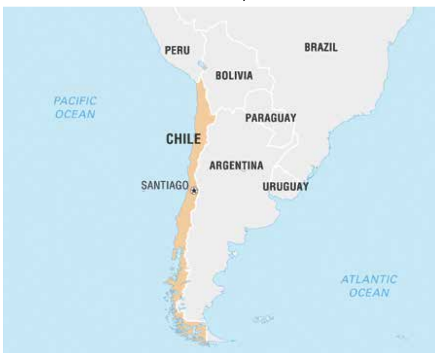
Položaj Čilea i glavnoga grada Santiaga na zemljovidu

Republika Čile je prema svim pokazateljima već dugi niz godina najbogatija zemlja Latinske Amerike. Ima najveći BDP po glavi stanovnika, uvjerljivo vodi