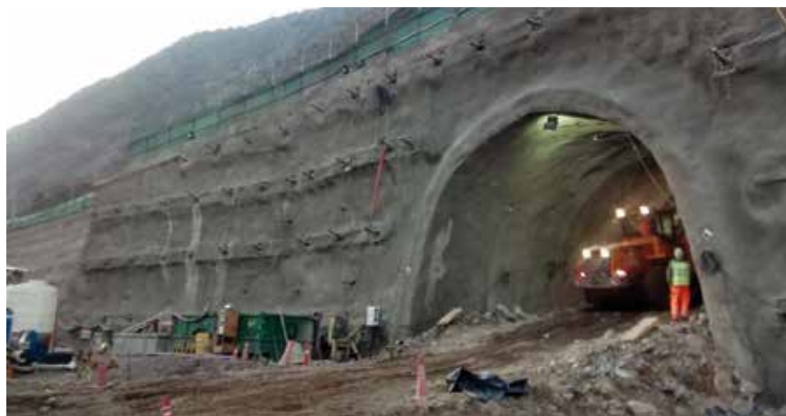
Alto Maipo - pogled na gradilište