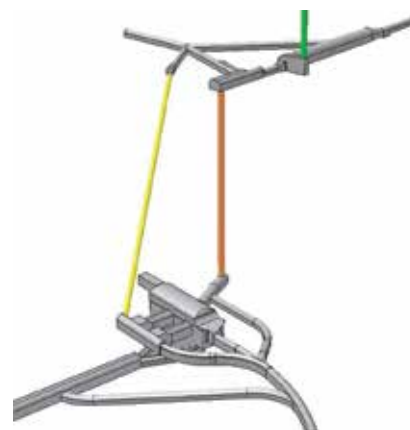
Trodimenzionalni prikaz šahta na prilazu kaverni strojarnica Alfafal II.

Nakon niza problema s osobljem na gradilištu, koje je negodovalo zbog radnih uvjeta, te brojnih poteškoća zbog geologije tla koja je bila znatno lošija od predviđene, u svibnju 2017. iz projekta se povukla zajednica izvođača CNM SpA . Na temelju odluke suda u Čileu investitor je zadržao jamstvo izvođača u iznosu od 76 milijuna dolara, iako su se izvođači žalili da moraju odustati od projekta zbog sigurnosti tijekom radova.