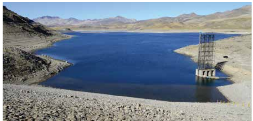
U Čileu je voda u stopostotnom privatnome vlasništvu

Valja razmotriti iskustvo susjedne Slovenije, prve članice EU-a koja je kon-