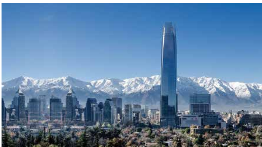
Noviji, sjeverozapadni dio grada moderno je uređen