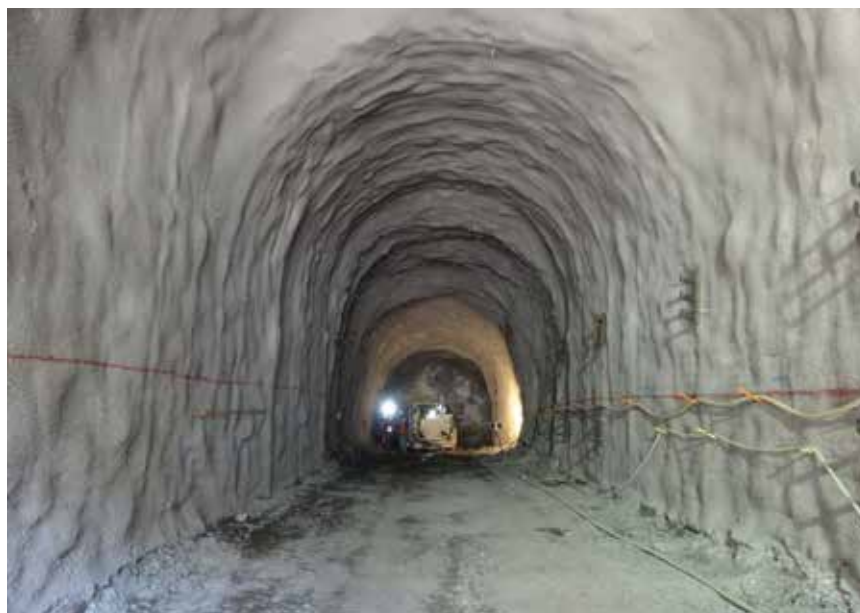
Iskop tunela V1 s primarnom podgradom osiguranom sidrima i prskanim betonom

Nakon drugoga refinanciranja projekta tijekom 2017. i u prvoj polovini 2018., u svibnju 2018. Strabag je sklopio ugovor o izvođenju južnoga dijela projekta i tako preuzeo izvedbu cjelokupnoga projekta. U tome trenutku bilo je dovršeno oko 60 posto svih planiranih radova na projektu. Ukupan iznos nakon refinanciranja projekta pokazuje da je krajem 2019. ukupno ulaganje u Alto Maipo iznosilo 3,5 milijardi dolara. Na gradilištu se trenutačno izvode radovi na bušenju tunela i betoniranju obloge, priprema se postavljanje opreme u kavernama u kojima će se montirati strojarnice te se izvode pripremni radovi za ostale elemente hidrotehnike opreme i instalacija.