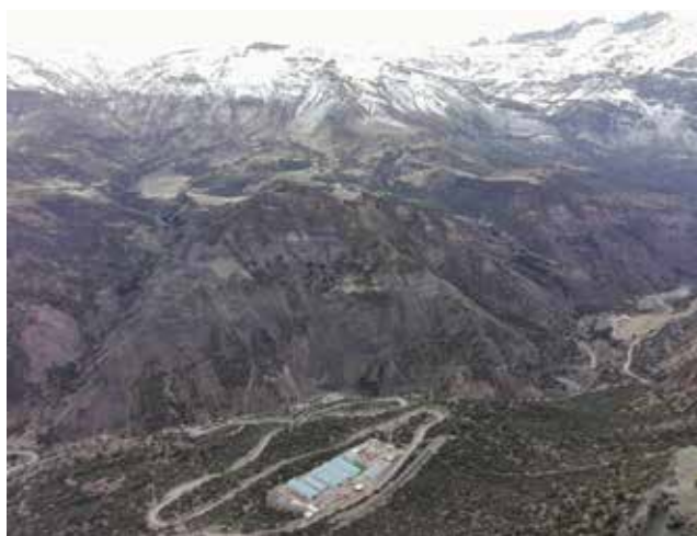
Pogled na kamp za radnike iz zračne perspektive