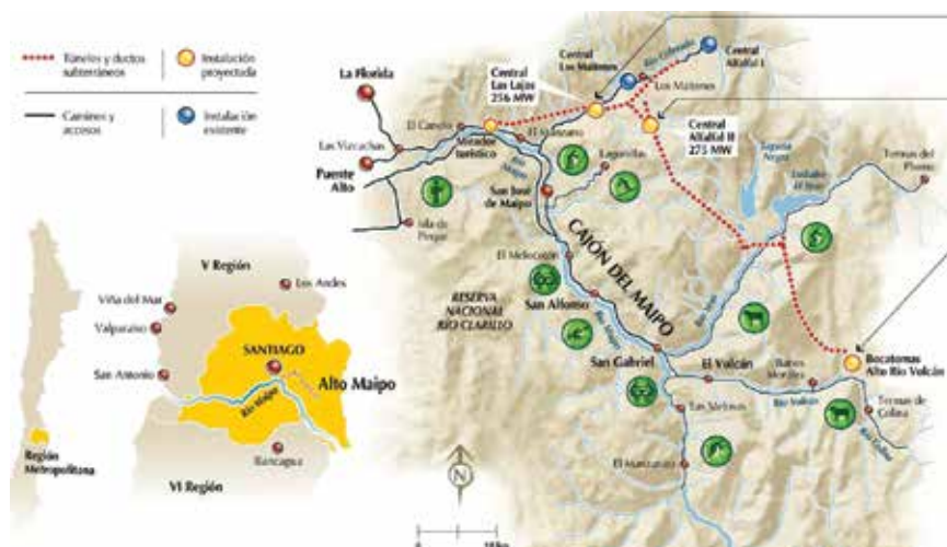
Prikaz sheme projekta Alto Maipo, koji se gradi u blizini Santiaga

njemačke tvrtke Hochtief i CMC Ravenna ). Ukupna vrijednost investicije u početku je bila procijenjena na 1,4 milijarde dolara, a završetak projekta očekivao se tijekom 2017., što se nije dogodilo zbog brojnih izazova u gradnji te gradnja traje i danas. Za glavni nadzor nad gradnjom odabrane su tvrtke Skava iz Čilea, Amberg iz Švicarske i Multiconsult iz Norveške. Zatvaranjem financijske konstrukcije tijekom ljeta 2013. označen je službeni početak radova, koji su počeli u studenome iste godine.