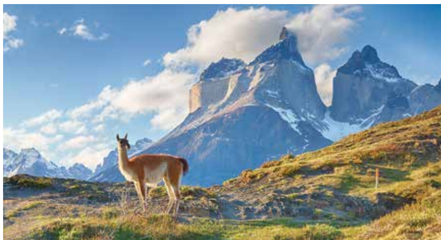
Prirodni krajolik s pogledom na planinski masiv Ande

industrijskoj proizvodnji zemlje sudjeluje s oko 50 posto. Uz prehrambenu, metalnu, elektrotehničku, kemijsku, drvenu te tekstilnu industriju ima razvijenu industriju prerade kože te proizvodnje papira, stakla i građevnoga materijala. Dva sveučilišta, vojne akademije, znanstvene i umjetničke ustanove daju mu ulogu kulturnoga središta. Trg Plaza de Armas središte je staroga kolonijalnog grada Santiaga, koji se nalazi u južnome dijelu grada.