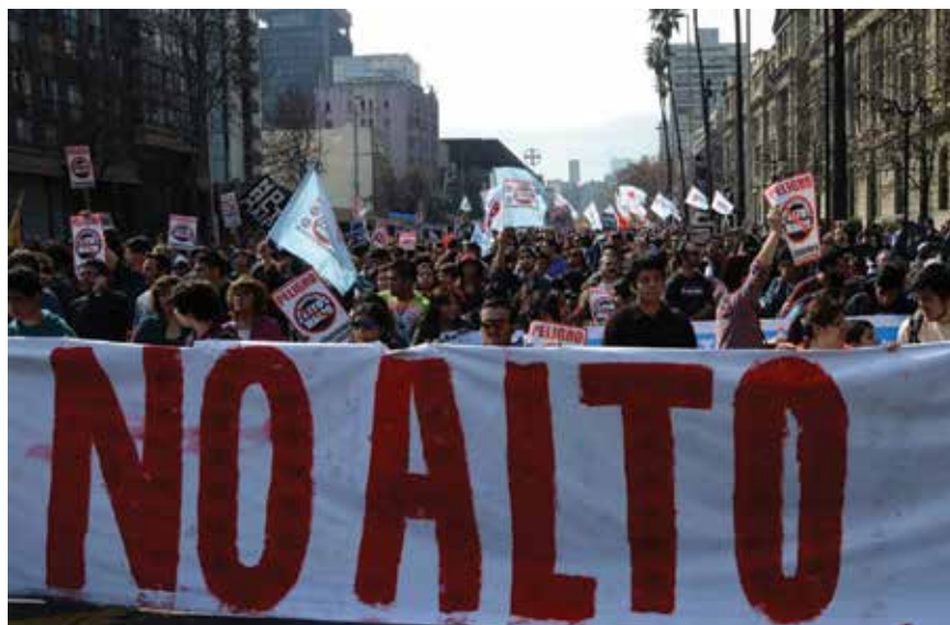
Prosvjedi protiv gradnje hidroelektrana Alto Maipo

U nekim slučajevima u svijetu pokazalo se da pravo na vodu ima negativne posljedice na manjine, pogotovo kada je uvedeno da bi riješilo probleme s vodom u većim gradovima, često na štetu domorodačkih zajednica. Takav je primjer Perua. U tome i sličnim slučajevima pokazalo se to da vlade imaju odgovornost zaštititi pristup ranjivih skupina vodi i sanitaciji. Slična zaštita određena je i sudskim procesima,