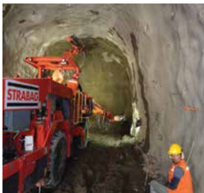
Projekt Alto Maipo bio je izložen prosvjedima stanovništva u Čileu

Kako bi zadovoljio svoje rastuće potrebe za energijom, Čile se oslanja na velike projekte opskrbe energijom i suočen je s otporom ekologa i lokalnoga stanovništva. Inicijativa širokoga karaktera koja se sastoji od ekoloških i turističkih udruga, lokalnih aktivista, sindikata, pravnika i političara snažno je negodovala protiv projekta izgradnje dviju novih hidroelektrana (Alfalfal II. i Las Lajas) u riječnome kanjonu Cajón del Maipo, što je dijelom usporilo građevinske radove na terenu. Te grupacije pritišću čileanski energetske div AES Gener otkako je počeo planirati projekt 2007. Iako je Čile najbogatija latinoamerička zemlja, nije baš sve tako idealno. Jedan od razloga čestih nemira u posljednjih nekoliko godina u Čileu je, među ostalim, nedostatak reguliranoga sustava o brizi o zaštiti okoliša i odnos prema vlasništvu vode za piće. Naime, u Čileu je u članku 24. Ustava iz 1980. definirano to da je voda u privatnome vlasništvu. Vodne rezerve ne pripadaju državi ili stanovništvu, već su u stopostotnome vlasništvu tvrtki iz Francuske, Španjolske i Italije.