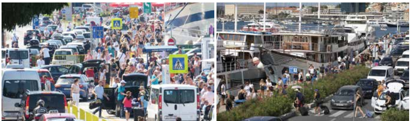
U trajektnoj luci Split potrebno je razriješiti goleme prometne probleme u pristupu luci

Rekonstrukcija Obale dio je velikoga investicijskog ciklusa poznatog pod nazivom "Renesansa na hrvatskoj obali" u sklopu kojega je do sada uloženo 1,3 milijarde kuna, najvećim dijelom iz EU-ovih fondova. Ulaganja se najviše odnose na pomorske luke, lukobrane i rive na otocima i priobalju. Ciklus ulaganja u lučku infrastrukturu u Hrvatskoj osmislilo je Ministarstvo mora, prometa i infrastrukture uz podršku Ministarstva regionalnoga razvoja i fondova Europske unije. Maksimalan iznos za sufinanciranje troškova projekta javnim sredstvima iznosi nešto više od 42 milijuna kuna, odnosno 100 posto prihvatljivih troškova projekta, od čega se približno 36 milijuna kuna, odnosno 85 posto, sufinancira iz Kohezijskog fonda EU-a preko Operativnog programa Konkurentnost i kohezija 2014. – 2020., a približno 6,3 milijuna kuna odnosno 15 posto iz Državnog proračuna Republike Hrvatske.