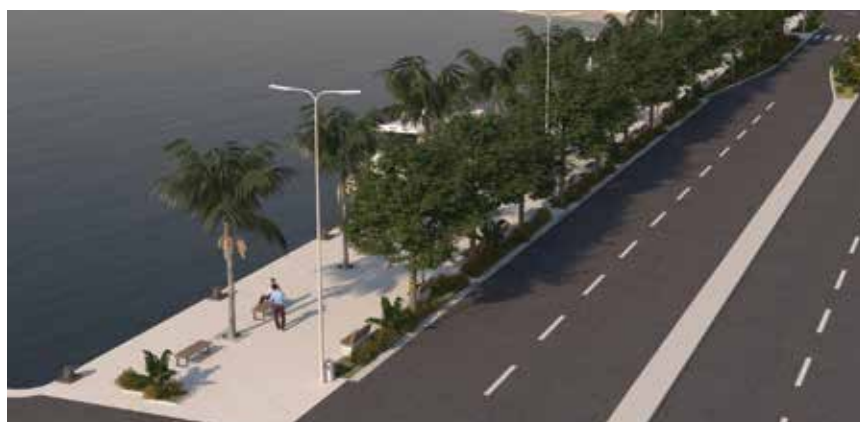
Obala će se proširiti za dodatnih 5 metara prema moru

Prema projektnome rješenju, Lučka uprava Split planira proširiti obalu za dodatnih 5,5 metara prema moru u duljini od približno 130 m (od Obale Lazareta do Gata svetog Petra) na Obali kneza Domagoja I. i od približno 125 m (do Gata svetog Duje) na Obali kneza Domagoja II. u Gradskoj luci Split. Radovi na projektu rekonstrukcije obalnoga dijela splitske luke