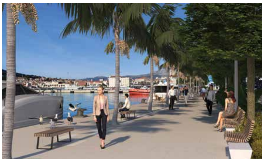
Novi dio obale zamišljen je kao javni prostor znatno većih kapaciteta i kvalitetnije funkcionalnosti