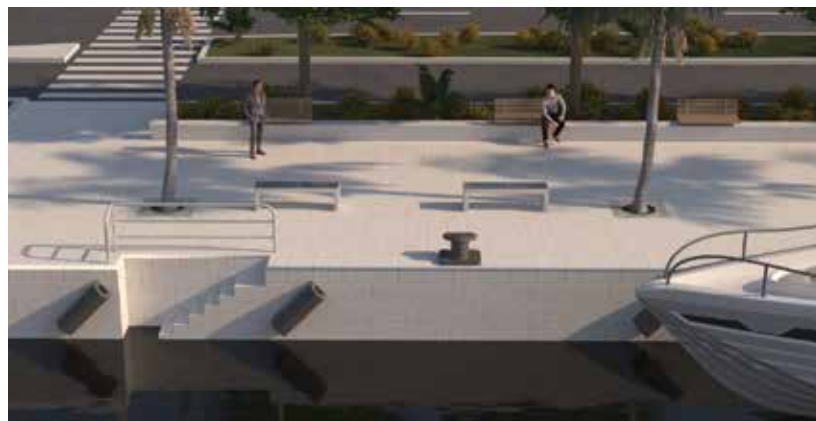
Duž nove operative obale bit će postavljene nove privezne bitve