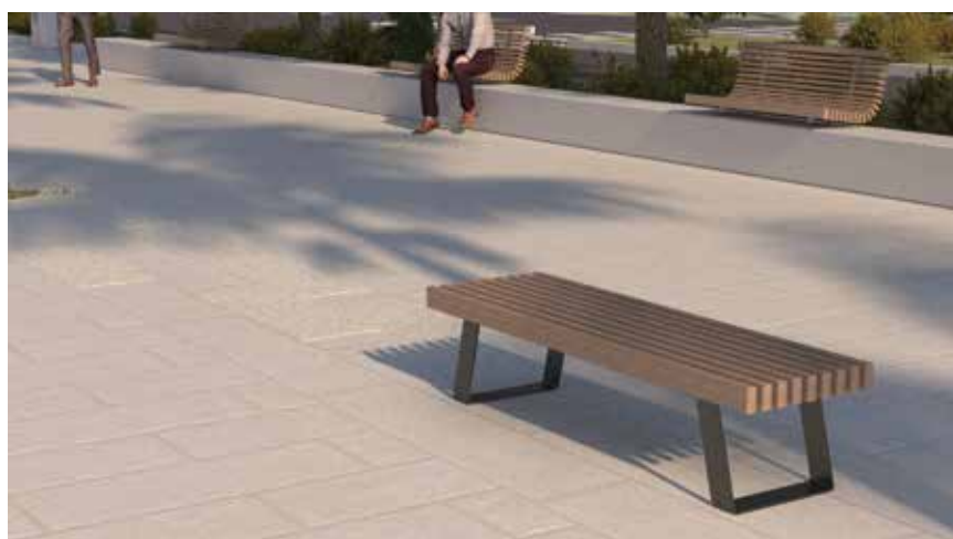
Detalji projektnog rješenja nove obale