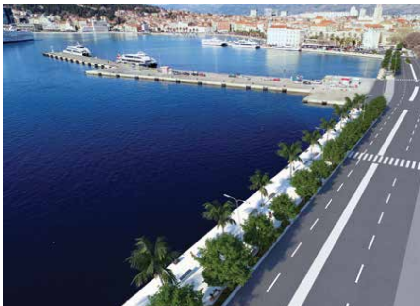
Vizualizacija novouređenog obalnog pojasa u Gradskoj luci Split

svečano su otvoreni 16. veljače 2021. u prisutnosti premijera Andreja Plenkovića, ministra mora, prometa i infrastrukture Olega Butkovića i ravnatelja Lučke uprave Splitsko-dalmatinske županije Vice Mihanovića. Planirani završetak projekata je 280 kalendarskih dana od dana uvođenja izvođača u posao, odnosno oko devet mjeseci, a stavljanje nove obale u funkciju očekuje se krajem 2021. Idejno rješenje, a zatim i glavni te izvedbeni projekt izradila je tvrtka Obala d.o.o. , a glavni projektant je dr.sc. Goran Vego, dipl.ing. građ. Za glavnoga izvođača radova kao najpovoljnija odabrana je zajednica ponuditelja koju čine tvrtke Pomgrad inženjering d.o.o. i Gradevno Zec d.o.o. , čija je ponuda iznosila približno 30,5 milijuna kuna. Za stručni nadzor odabrana je zajednica ponuditelja koju čine tvrtke Kozina projekt d.o.o. i Terestrika d.o.o. , a glavni