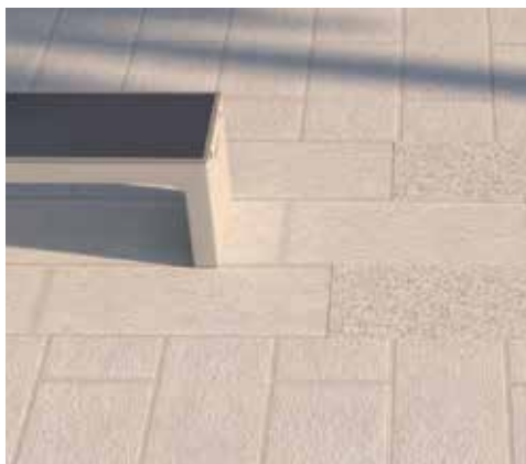
Kombinacija postojećih i novih kamenih ploča na šetnici