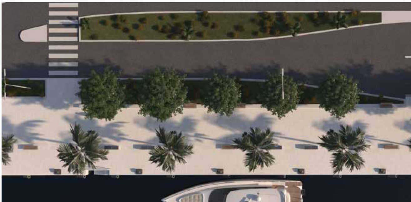
Novom šetnicom Gradska luka Split dobit će modernije, sigurnije i funkcionalno korisnije površine

pada tijekom izgradnje bit će sveden na najmanju moguću mjeru postavljanjem primjerenih vodonepropusnih spremnika te predavanjem toga posla ovlaštenim pravnim osobama za sakupljanje otpada.