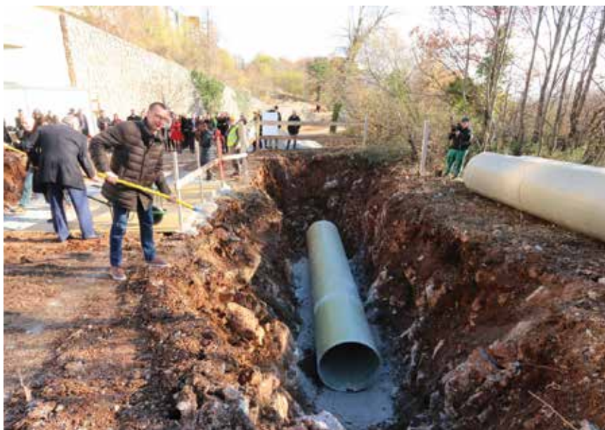
Osim proširenja i dogradnje sustava vodoopskrbe i odvodnje predviđena je optimizacija postojećega mješovitog sustava javne odvodnje