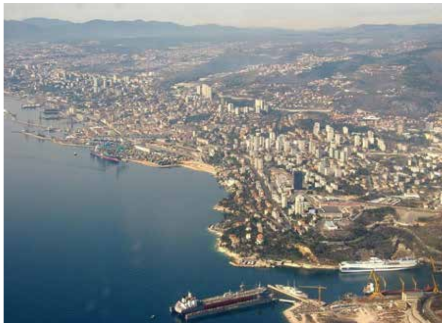
Projektom će se opseg priključenosti stanovništva aglomeracije Rijeka na javnu odvodnju povećati za 75 posto na oko 92 posto