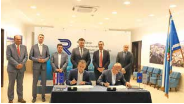
Potpisivanja ugovora o izvođenju novih grupa radova aglomeracije Rijeka