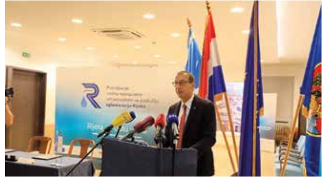
Marko Filipović, gradonačelnik grada Rijeke

nja vodovoda u pojedinim ulicama bez javne vodoopskrbe, što će se financirati lokalnim sredstvima. Radovi su vrijedni 272.238.235,78 kn (bez PDV-a), a nakon što izvođač bude uveden u posao, radovi bi trebali trajati 53 mjeseca.