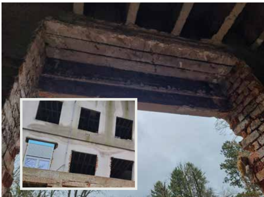
Radovi na otvorima za prilagodbu nove stolarije