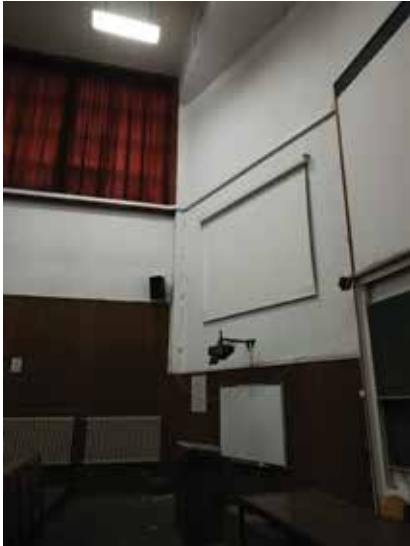
Oštećenja od potresa dvorane u aneksu

radom 1. siječnja 1960. Prvim Statutom Šumarski fakultet definiran je kao znanstvena i najviša nastavna ustanova za šumarstvo i drvnu industriju. Dovršena je gradnja prvoga (zelenoga) krila nove zgrade Šumarskoga fakulteta. U njega su 27. veljače 2002. useljena tri zavoda Šumarskoga odsjeka, a 2007. i preostala dva krila u koja su preseljeni preostali zavodi Šumarskog odsjeka, knjižnica, dekanat i prateće službe..