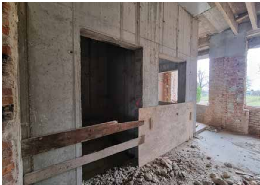
Izvedene su nove jezgre dizala

Glavni ulaz u IV. paviljon nalazi se u prizemlju, na koti \pm 0.00 . U prizemlje se spušta kroz bočna stubišta koja su položena na središnjemu dijelu, duž strane sjeverno-