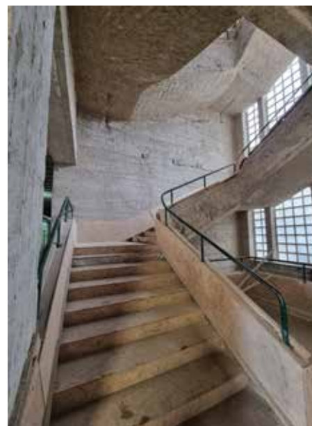
Projektom se zahtjevala zaštita postojećeg terrazza na stubištu