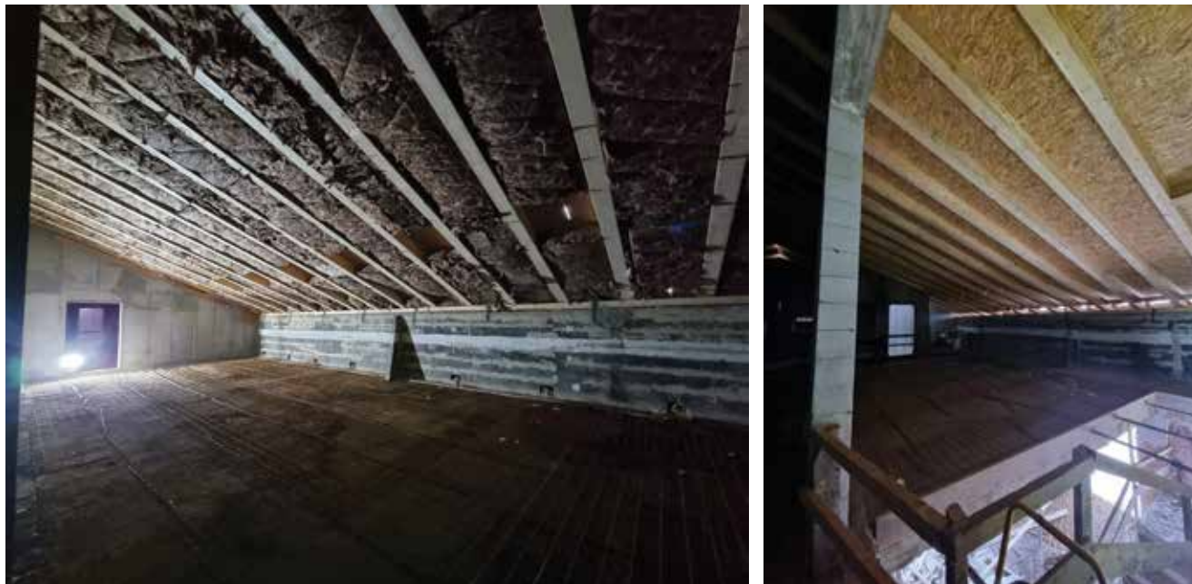
Radovi u potkrovlju IV paviljona

ga pročelja glavnoga dijela zgrade u koji se kroz vjetrobran ulazi izravno u središnji ulazni hol u kojemu se nalazi porta. Postojeće središnje trokrako stubište nalazi se izravno kod glavnoga ulaznog hola s lijeve i desne strane koje povezuje djelomično podrum, prizemlje, prvi i drugi kat te služi kao evakuacijski put. Unutar zgrade, uz zabatne zidove istočnoga i zapadnoga krila paviljona nalazi se dvokrako stubište koje povezuje podrum, prizemlje, prvi i drugi kat te potkrovlje i ono se projektom protupožarno pregrađuje po svim etažama.