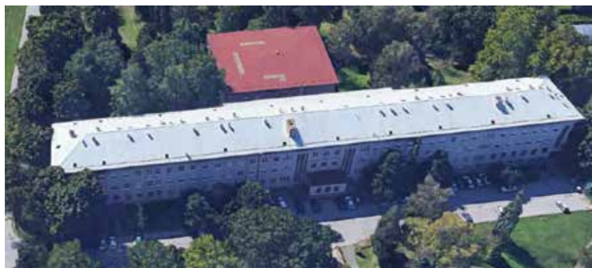
Zgrade Fakulteta šumarstva i drvne tehnologije prije obnove

Potpuno osamostaljeni Šumarski fakultet Sveučilišta u Zagrebu počeo je s