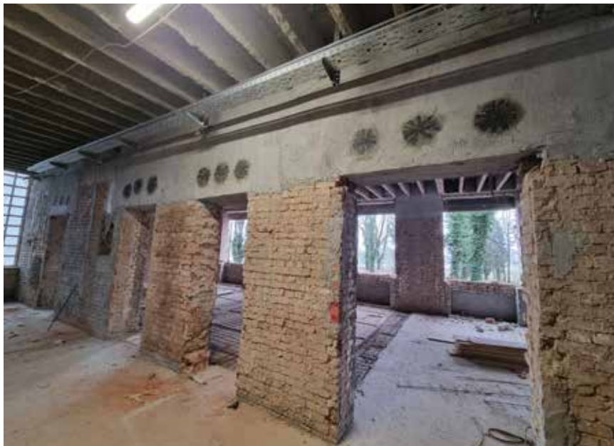
Ojačanja zidova od opeke

a u potkrovlju drvenim ili čeličnim ojačanjima na spoju s krovnom konstrukcijom.