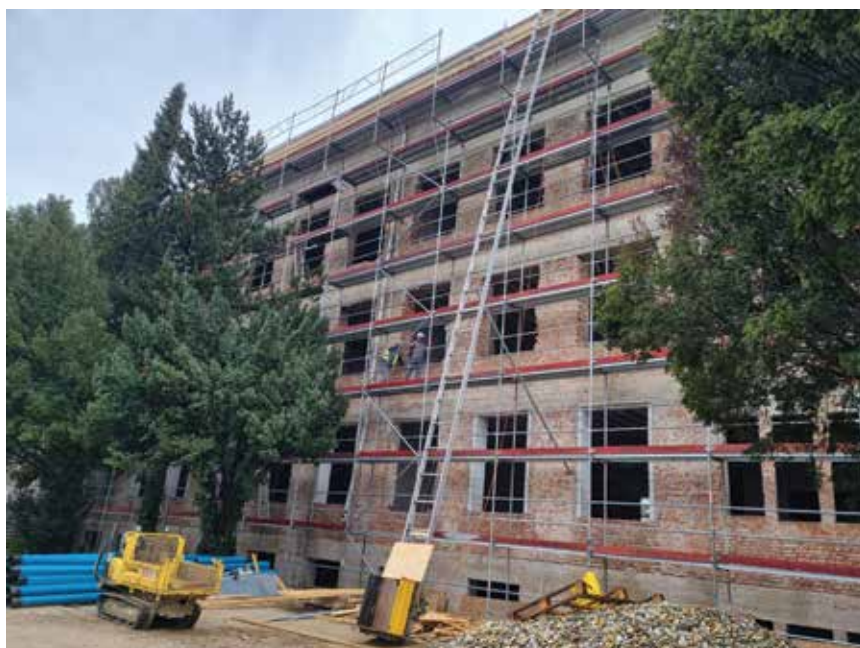
Pogled na gradilište sa sjeverne strane

Projektom su planirane intervencije u smislu prilagođavanja funkcija i sadržaja suvremenim potrebama, ali bez bitnih izmjena sačuvanih elemenata povijesnih struktura (oblik građevine, gabariti, oblikovni elementi pročelja i dr.), i to metodom konzervacije, sanacije, rekonstrukcije, re-kompozicije i integracije radi povezivanja povijesnih struktura i sadržaja s novima koji proizlaze iz suvremenih potreba. Zbog maksimalnoga očuvanja i uređenja postojećega, izvornoga stanja zajedničkih dijelova vanjštine i unutrašnjosti zgrade te sustava nosive konstrukcije obnova nosive konstrukcije zgrade izvodit će se na minimalno invazivan način koji će omogućiti intaktnost svih očuvanih graditeljsko-obrtničkih elemenata i izvornih obilježaja.