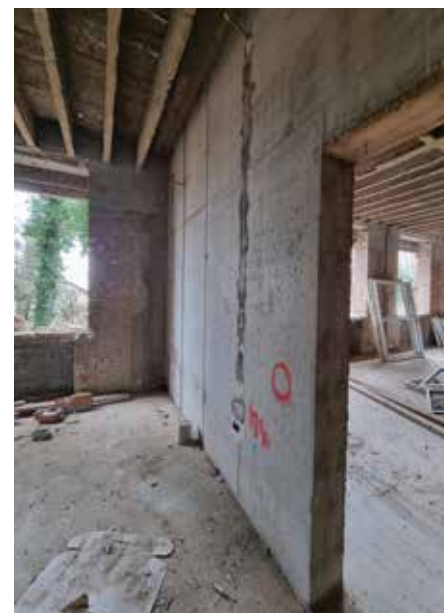
Ojačavanje postojećih zidova i stropova (lijevo) te izvedba AB radova (desno)