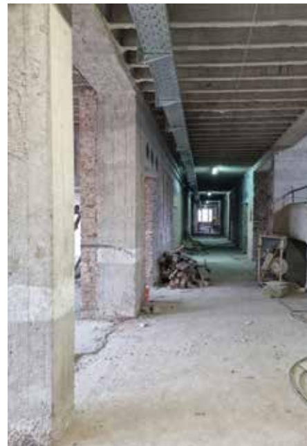
Detalji s gradilišta

obnova zidova podruma izvodi se torketiranjem ili dodavanjem sloja armiranoga betona. Ojačanje postojećih zidanih zidova izvodi se FRP tehnologijom uz povezivanje sa stropovima i zidovima.