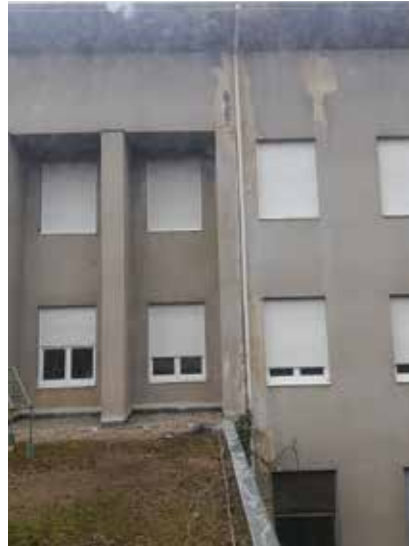
i južnog pročelja

Prema navedenom projektu izgrađeni su I., II. i III. paviljon. Tijekom Drugoga svjetskog rata počela je izgradnja IV. paviljona fakultetskoga sklopa, koji dimenzijom i pozicijom nije bio usklađen s osnovnim idejnim rješenjem cijeloga