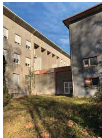
Nekadašnja veza između paviljona i aneksa