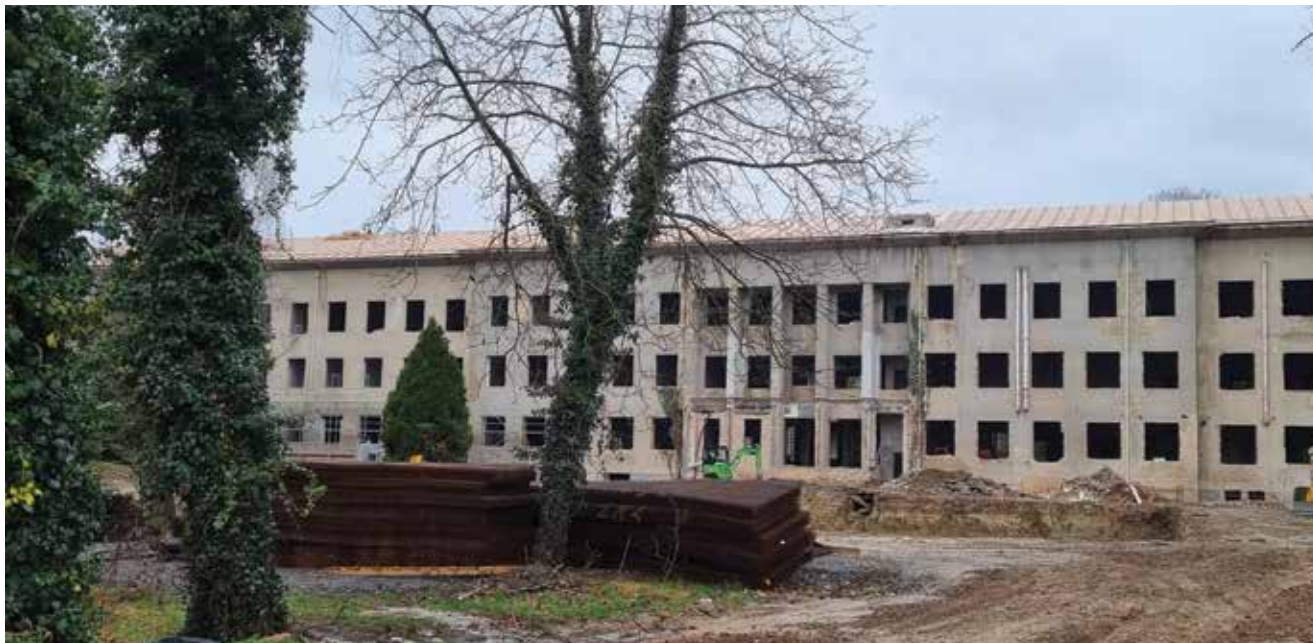
Pogled na gradilište s južne strane

postići će se mehanička otpornost i stabilnost zgrade na potresno djelovanje.