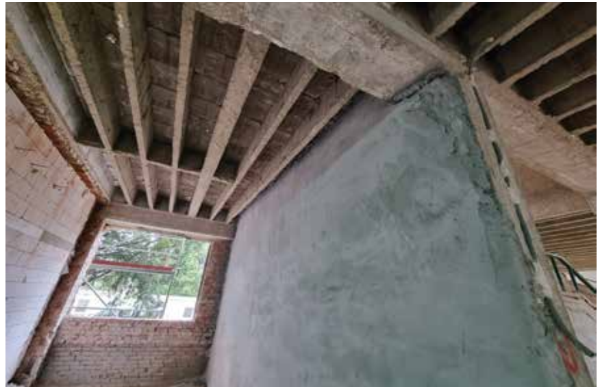
Izvedba novih AB zidova