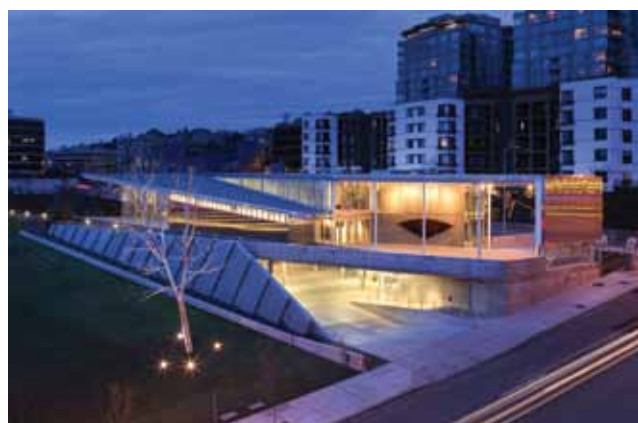
Slika 2. Muzej umjetnosti i Olimpijski park skulptura, (Seattle, SAD), 2009.

Tipičan braunfield proces regeneracije počinje procjenom prostora s aspekta kontaminiranosti i ako se ispostavi da nema negativnih utjecaja na životnu sredinu i ekoloških rizika, odmah se može početi s obnovom. U suprotnom, pristupa se procesu dekontaminacije, zatim ponovno ispitivanje kvalitete