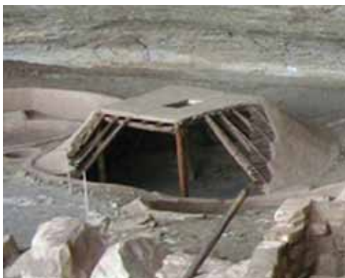
Slika 3. Kontaminirana površina, Austin, Texas (postojeće stanje)

Kamen temeljac U.S. EPA braunfield inicijative jest braunfield probni program ( www.epa.gov/brownfields ) kojega je cilj da se društvene grupe, programeri, investitori i druge zainteresirane strane uključe u braunfield aktivnosti. Mnoge su države uspostavile volonterske programe za poticanje procjene, čišćenja i regeneracije braunfield površina. EPA je razvila i niz tehničkih uputa i vodiča za tretiranje braunfield površina. Površine s visokim nivoom kontaminacije pripadaju površinama s visokim rizikom, dok se one koje imaju znatno manji rizik za stanovništvo i životnu sredinu smatraju površinama s niskim rizikom, koje ujedno i prevladavaju. Agencija za zaštitu životne sredine EPA teži formuliranju i provođenju akcija koje vode prema kompatibilnoj ravnoteži između ljudskih aktivnosti i prirodnih sustava. U aktualnom stanju životne sredine, gdje su prisutne globalne klimatske promjene, iscrpljivanje resursa, onečišćenje zraka, vode, braunfield regeneracija je prvi korak u stvaranju neke prividne američke kulture. "Pametne strategije rasta" mogu biti rješenje za održivu budućnost gradova [6]. Na slikama 3. i 4. su uspješna rješenja dekontaminacije braunfield površine u gradu Austinu i prenamjena u eko-stambenu građevinu kojoj su osnova obnovljivi izvori energije.