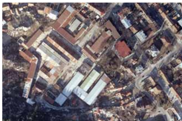
Slika 6. Braunfild industrijska zona "Stari Obod" - postojeće stanje

U kontekstu održivoga urbanističkog razvoja gradova, posljednjih je godina veća zainteresiranost za upravljanjem kvalitetom životne sredine. U Crnoj su Gori 2008. i 2010. realizirana dva posebno značajna međunarodna arhitektonsko-urbanistička natječaja za regeneraciju braunfilda . U Cetinju je površina "Stari Obod" predviđena za prenamjenu u Sveučilište umjetnosti (fakultet likovnih, muzičkih i dramskih umjetnosti, slike 6., 7. i 8.) i u Mojkovcu "Jalovište", radi prenamjene u Sportsko-rekreativni centar. "Jalovište" u Mojkovcu bilo je jedno od najkontaminiranijih prostora u Crnoj Gori s najvećim ekološkim rizikom. Tijekom 2008. i 2009. sanirano je u etapama i, procjenjuje se, uspješno dekontaminirano. Inače sam termin braunfild vrlo je rijedak u upotrebi u Crnoj Gori, a sam odnos prema kritičnim prostorima u gradovima nije dosegao razinu koja je nužna za održivu urbanu regeneraciju i održivi razvoj lokalne sredine.