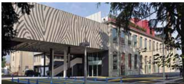
Slika 5. Prenamjena stare industrijske građevine u muzej, Cormanò kraj Milana, Italija

Na slici 5. je jedan od primjera uspješne braunfild regeneracije u Italiji, prenamjena stare industrijske građevine u muzej, Cormanò kraj Milana, Italija