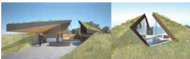
Slika 4. "Red Bluff" stanovanje: Austin, Texas, 2010.

U europskom su kontekstu inicijative za pitanje braunfield površina posebno razvijene od početka 1980-ih godina u Velikoj Britaniji, Francuskoj, Njemačkoj, koje favoriziraju regionalnu politiku degradiranog zemljišta i stvaraju specifične programe za uništeno zemljište i oporabu. Ove su inicijative aktivirane zbog povećane svijesti o negativnim ekološkim i ekonomskim efektima, ali i potencijalima koje imaju braunfield površine. Europski su gradovi zbog suočavanja s različitim problemima razvili različite strategije urbane regeneracije u posljednja dva desetljeća. Fizička rehabilitacija, socijalna kohezija, smanjen ekološki rizik te ekonomski poticaj ključni su pravci održive braunfield regeneracije u europskom kontekstu. Porastao je broj aktivnosti koje su vezane za braunfield politiku i programe, strategije i konkretne praktične intervencije. Osim toga, brojni su i raznoliki istraživački projekti realizirani kako bi usmjerili i olakšali pravce braunfield regeneracije i održivi razvoj gradova. Pravni, politički i drugi utjecaji uvelike determiniraju tempo braunfield regeneracije i oblike transformacije [31]. Inženjerske funkcije u procesu braunfield regeneracije uključuju [15]: