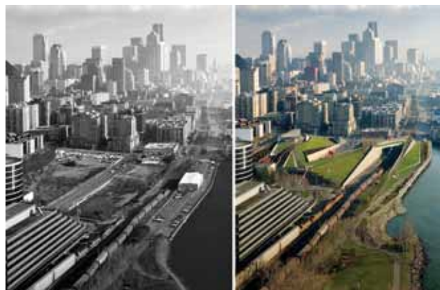
Slika 1. Transformacija urbanog braunfielda , povezivanje grada s obalom (Seattle, SAD), 2009.

Na slikama 1. i 2. prikazana je uspješna revitalizacija industrijskog urbanog dijela Seattla, povezivanje grada s obalom kroz stvaranje novoga pejzaža za umjetnost, izgradnju Muzeja umjetnosti i Olimpijskog parka skulptura gdje se razvijaju novi oblici interpretacije umjetnosti, ekologije i urbanog angažiranja.