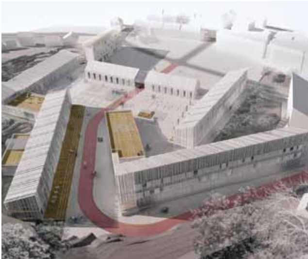
Slika 8. Braunfeld regeneracija - sveučilišni kampus na Cetinju (I. nagrada na arhitektonsko-urbanističkom natječaju, 2009.)

U Crnoj Gori, kao i u državama u okruženju praktični se problemi braunfilda rješavaju uglavnom na nivou lokalnih zajednica. Još uvijek ne postoji čvrsta i jasna strategijska i upravljačka platforma na državnim nivoima koja će poticati značajno investiranje u braunfild i unapređivati urbanu regeneraciju i održivi razvoj. U drugim sredinama neki od autora koji su se bavili pitanjima braunfilda sa znanstvenog gledišta, u Srbiji [36, 37], u Hrvatskoj [38, 39, 40] konstatiraju da je potrebno uložiti više energije u razmatranje ovog problema i da je potrebno jačati javno-privatno partnerstvo i strategije investiranja u braunfild kao važne karike u održivom razvoju gradova.