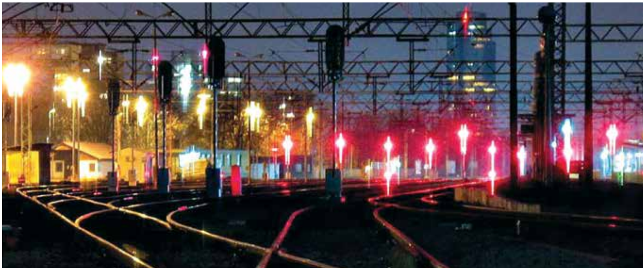
Noć na Glavnom kolodvoru nakon ugradnje novoga signalno-sigurnosnog sustava

Bio je organiziran i poseban prijevoz putnika od Glavnog kolodvora do kolodvora Resnik autobusima tvrtke Croatia-express , a ZET je u tom razdoblju bio uveo posebnu tramvajsku liniju koja je vozila od okretišta u Borongaju do Zapadnog kolodvora.