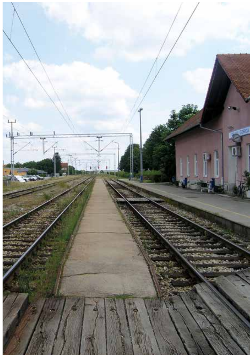
Kolodvor Velika Gorica bit će temeljito rekonstruiran

Ovoliko pokrenutih kapitalnih remonta pruge pokazuje nakon dugog vremena neodržavanja, dijelom uzrokovanog ratnim zbivanjima, da se željezničke pruge pokušavaju, čini se, ponovno osposobiti da preuzmu važan dio u cjelokupnome prometno-transportnom sustavu. Za