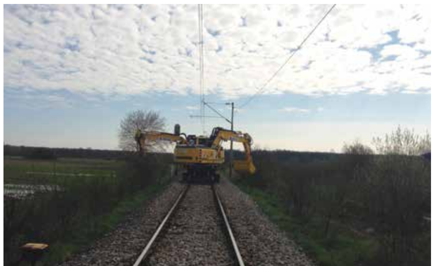
Detalj s remonta dionice Zdenčina – Jastrebarsko

Na dionici postoji pet željezničko-cestovnih prijelaza od kojih su dva asfaltirana i osigurana svjetlosno-zvučnim signalima (jedan i polubranikom), a ostali su neasfaltirani. U stajalištu De-