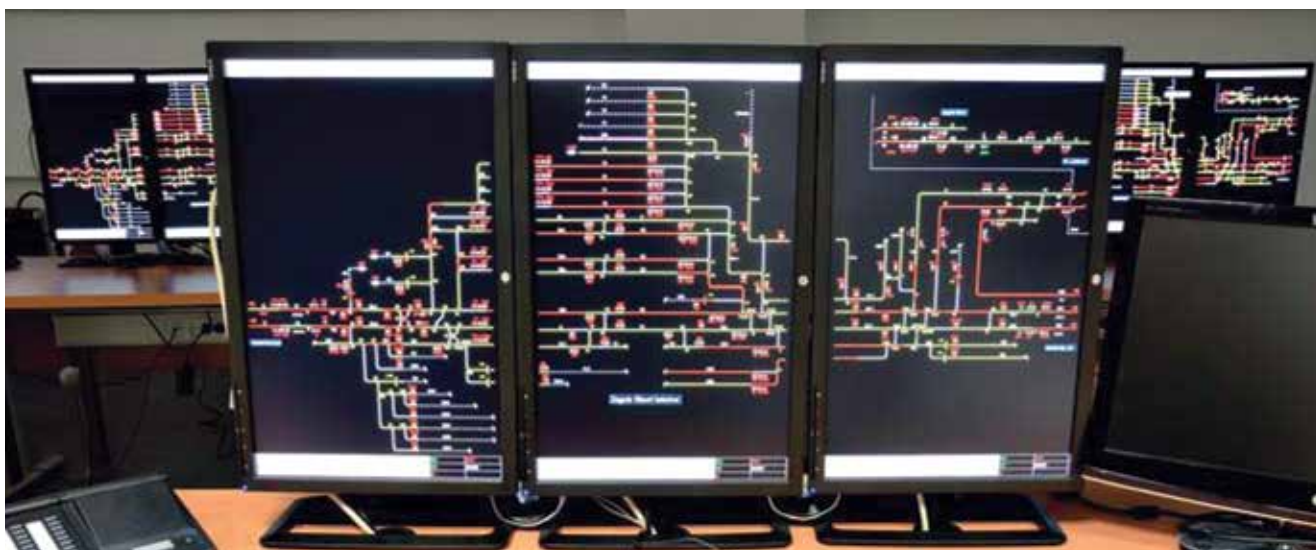
Novi komandni stol prometnika

Radovi su trajali deset dana i kolodvor je 11. ožujka pušten u promet. Ipak vlakovi su kasnili još nekoliko dana, posebno oni koji su stizali s istoka, jer je trebalo još nekoliko dana da se svi uređaji detaljno ispitaju, ali i da se strojno i prometno osoblje prilagodi novim uvjetima.