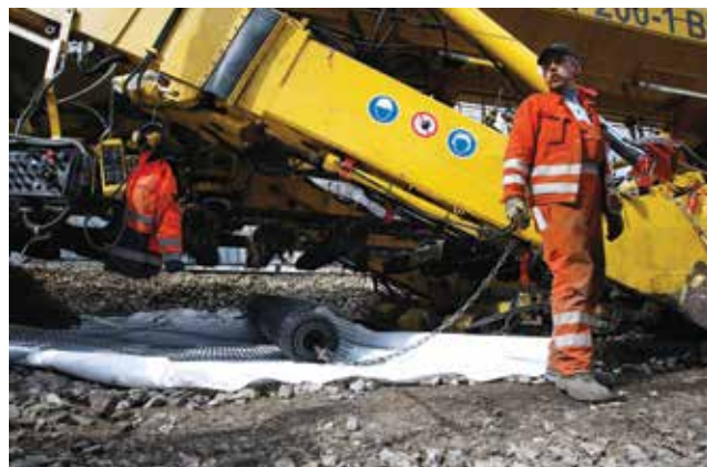
Početak radova na dionici Zdenčina – Jastrebarsko

ranje kolosijeka i nastavljeni su radovi na antikoroziivnoj zaštiti. U početku se promet svakodnevno zatvarao od 8 do 14 sati, a potom od 8 do 18 sati. Pritom je promet od kolodvora Velika Gorica do zagrebačkoga Glavnog kolodvora tekao preko kolodvora Resnik, s tim što su između kolodvora Velika Gorica, preko kolodvora Odra do kolodvora Klara vozili autobusi Croatia-expressa .