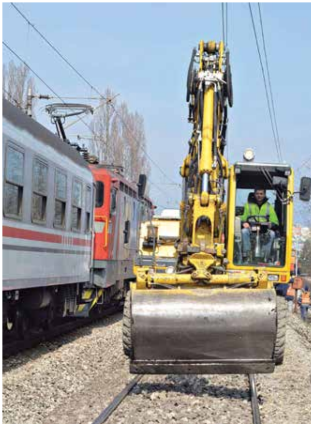
Bager u radu i prolazak putničkog vlaka