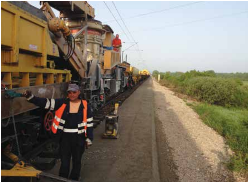
Strojno postrojenje za izmjenu tamponskog sloja na dionici Zdenčina – Jastrebarsko

a u projektu koji je također izradilo Željezničko projektno društvo iz Zagreba (glavni projektant Zvonimir Siščan, građ. teh.) isključeni su i jedan i drugi polazni kolodvor tako da je početak dionice izlaz iz kolodvora Zdenčina, a završetak na početku kolodvora Jastrebarsko. Inače je dionica u pravcu i horizontali te s nagibom od 5,3 ‰ i po karakteristikama je prava ravničarska pruga. Najčešće je u razini terena, dijelom u nasipu od 5 m ili u usjeku do 2 m. Prolazi kroz poljoprivredno zemljište, a mjestimice kroz šumu i šikaru.