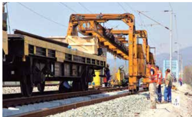
Kapitalni remont pruge pokraj mosta preko Save