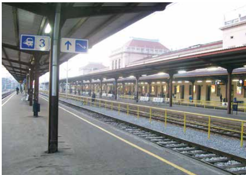
Peroni zagrebačkoga Glavnog kolodvora

Nekako su najsloženiji zahvati na prugama i kolodvorima u sastavu najprometnijega hrvatskoga željezničkog čvorišta jer uzrokuju prekide prometa na mnogim pravcima, ali i prilagođavanje i organiziranje zamjenskoga prometa. Ipak se jedan od najsloženijih zahvata nije odnosio na remont ili dogradnju željezničke pruge već na zamjenu zastarjelih signalno-sigurnosnih uređaja na Zagreb Glavnom kolodvoru.