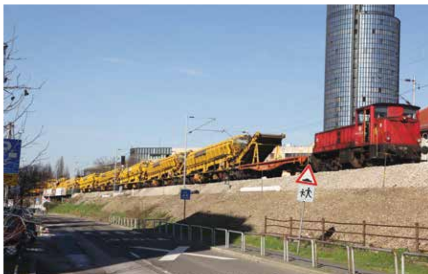
Postrojenje za izradu tamponskog sloja pokraj Cibonina nebodera

dipl. ing. građ. iz HŽ Infrastrukture . Prva je faza obuhvatila ugradnju tamponskog sloja pružnim postrojenjem. Radovi su započeli 13. ožujka i trebali su završiti 7. travnja, ali su zbog nepovoljnih vremenskih uvjeta bili nešto produženi. U početku su radnici Pružnih građevina , tvrtke koja je nakon reorganizacije HŽ-a znatno povećana, obavljali tijekom noći radove na anti-korozivnoj zaštiti stupova kontaktne mreže, a potom su se tijekom dana, od 8 do 18 sati obavljali radovi strojne izmjene tamponskog sloja (debljine 40 cm) te ugradnje geotekstila i geomreža. Tada se ujedno obavljalo strojno reguli-