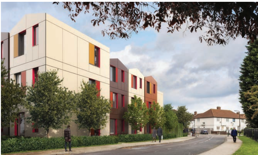
Mogućnost povezivanja stambenih jedinica

niskih plaća i visokih najmnina nekretnina ne dopuštaju osamostaljivanje. Napredovanjima u poslu dobivaju neovisnost u hostelskom smještaju, ali se kada dođe vrijeme napuštanja javljaju veliki problemi jer se nemaju kamo preseliti.