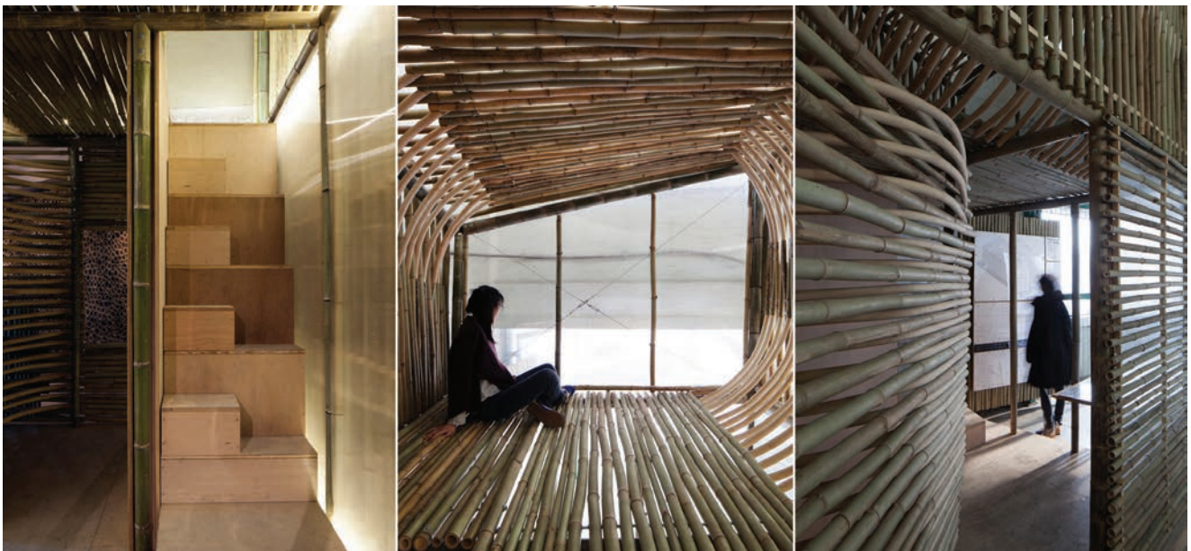
Unutrašnjost kuće od bambusa

Ideja je da se brojne stambene jedinice kombiniraju i grupiraju što ih čini pogodnim za pojedince, parove ili cijele obitelji. Individualni će domovi imati odvojene priključke za vodu i struju te po-