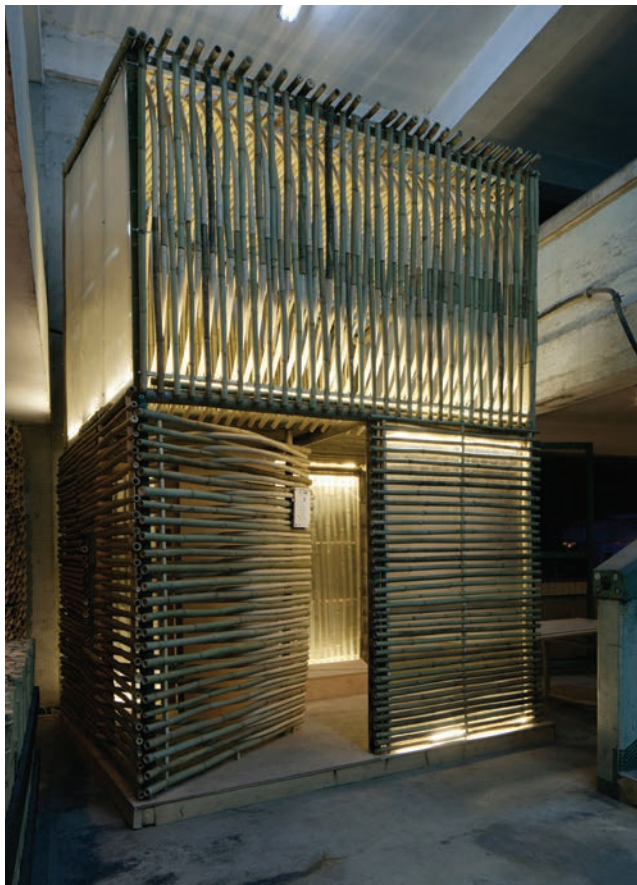
Dom od bambusa u napuštenoj tvornici

seбно mjesto za odlaganje otpada, dok će povezane grupe dijeliti hlađenje i grijanje te će biti zaštićene od vremenskih nepogoda industrijskim strukturama u kojima će biti smještene. Modularnost će tranzicijskoga stambenog sustava ovisno o potražnji utjecati na rast ili smanjivanje broja jedinica.