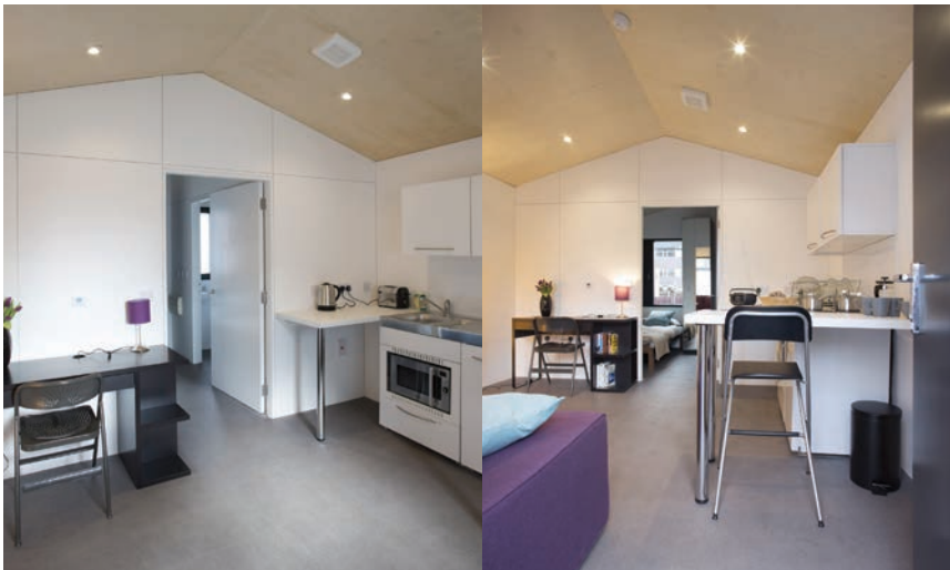
Unutrašnjost jedne stambene jedinice