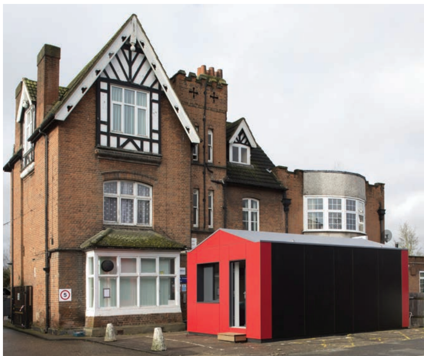
Y:Cube postavljen ispred tradicionalne londonske kuće

veću stambenu krizu mladih. Rešenje je proizvedeno u suradnji s proizvođačem drvenih panela za građenje Insulshell Ltd. i nazvano Y:Cube (u slobodnom prijevodu: Kocka za mlade). Zapravo to je maleni dom, uglavnom izgrađen korištenjem obnovljivih materijala, a stana-rima nudi neovisnost i privatnost koje inače nema u zajedničkom hostelu. Unutrašnji prostor Y:Cubea ima 26 m 2 i može se usporediti s prostorom tzv. studio-apartmana, pogodnog za jednu osobu. Svaki je stan predgotovljen u tvornici uporabom obnovljivog drva kao primarnoga građevnog materijala, zajedno s nužnim vodovodom i grijanjem te ugrađenim elektroinstalacijama. Takav modularni sustav omogućuje stambenim jedinicama Y:Cubea da se lako postave jedna uz drugu ili jedna na drugu, u klasterima od 24 do 40 na odabranim jeftinijim parcelama. Unutrašnjost se sastoji od spavaće sobe, kupao-nice, kuhinje i dnevnog boravka u jednom prostoru. Uočljiv je stupanj prilagodljivosti jer raspored nudi mogućnost drukčije organizacije pregradnih zidova, ali i dodavanja novih prozora. Mladi se ljudi teško bore s troškom iznajmljivanja, ali čak i zaposlenima kombinacija