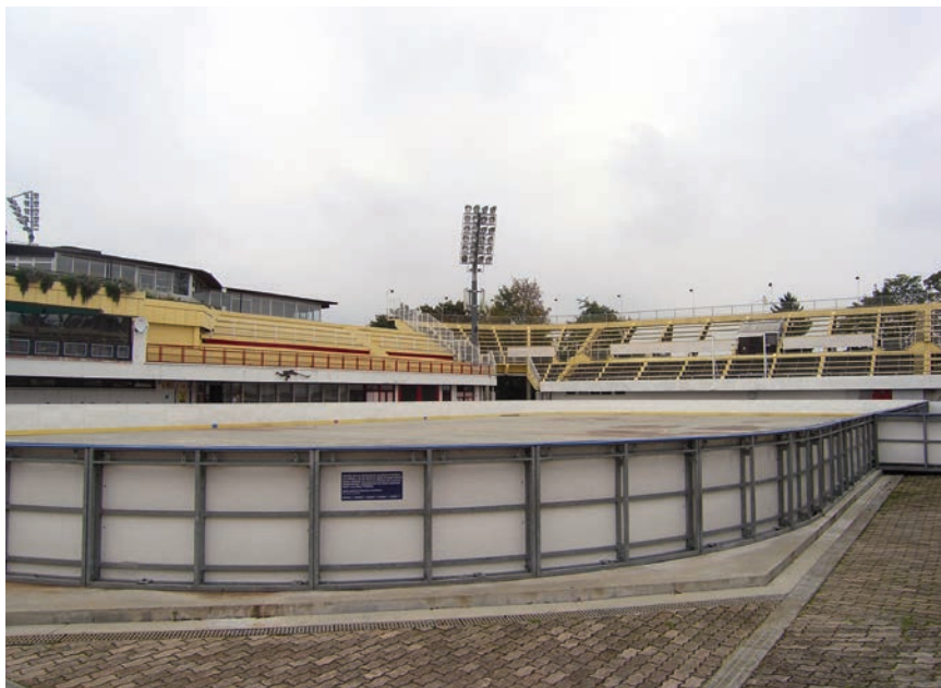
Glavni sportski teren i povremeno klizalište na Šalati

zvaao Trg Republike) udaljen jedva tristo-tinjak metara zračne linije. Pobjrojana su sva važna sportska zbivanja što su se na tome mjestu odigrala u povijesti (naime kompleks se počeo graditi još 1928.), ali je i istaknuto da će se Šalati pokušati vratiti stari sjaj i dati nove funkcije za odmor, razonodu i rekreaciju. Naime adaptirani su se svi postojeći i izgrađeni brojni novi sadržaji.