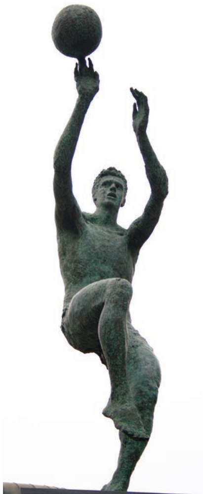
Spomenik Draženu Petroviću, rad kipara Kuzme Kovačića

Industrogradnja koja je sudjelovala u građenju sportskog parka Mladosti već