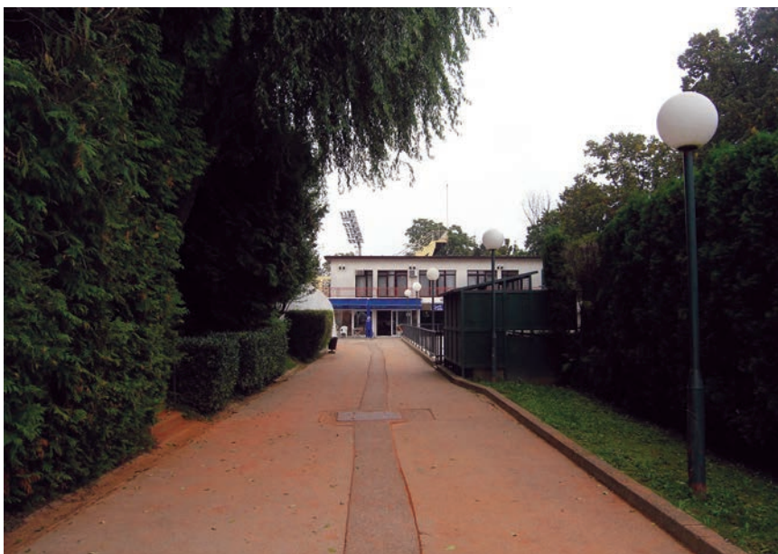
Glavni ulaz u Sportsko-rekreacijski centar Šalata

kreacijski kompleks Šalata , Sportski park Mladosti i Sportsko-poslovni kompleks Cibona . Budući da smo sva ta gradilišta opisali u članku u kojem je prikazano to veliko sportsko događanje ( Građevinar , br. 9./2014.), preskočit ćemo većinu podataka o tim velikim gradilištima i sadašnjim građevinama.