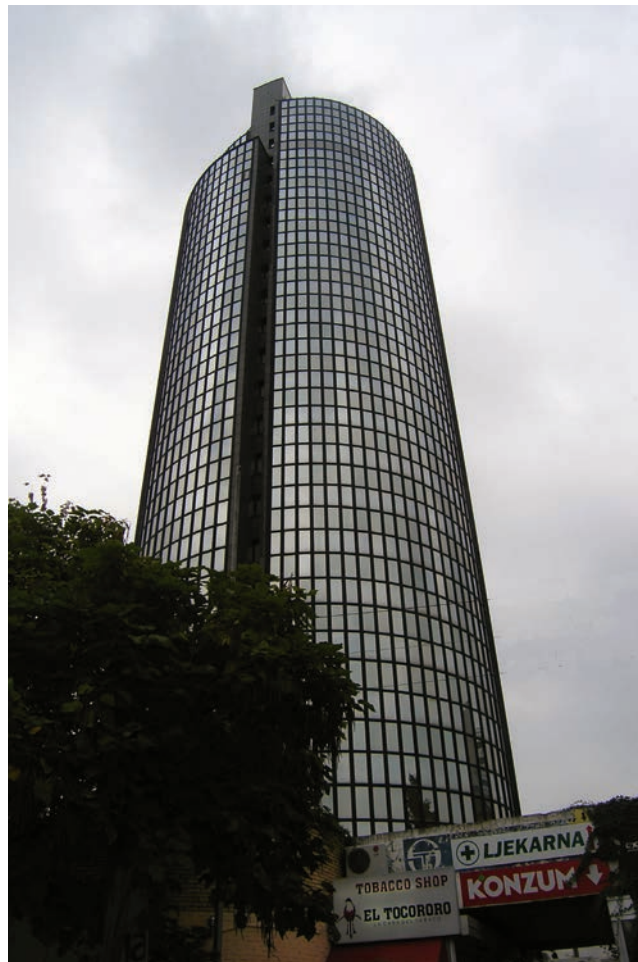
Sadašnji izgled tornja u kompleksu Cibona

Inicijativa za gradnju potekla je od KK Cibona , a dvorana je od početka bila dio sportskog programa Univerzijade , ali je investitor bio izvođač – GRO Vladimir Gortan . Budući da je unaprijed sav raspoloživi budući poslovni prostor bio prodan, dvorana se dijelom gradila iz tih sredstava. Kupaca je bilo mnogo, a većinski su vlasnici poslovnih prostora u tornju bili Ekspordrvo i Gramat , dok je Privredna banka bila zakupila prostore na Savskoj cesti.