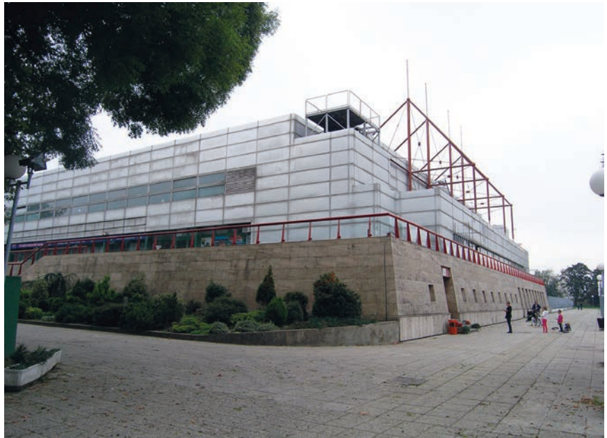
Sjeverno i zapadno pročelje plivačkog i vaterpolo centra Mladost