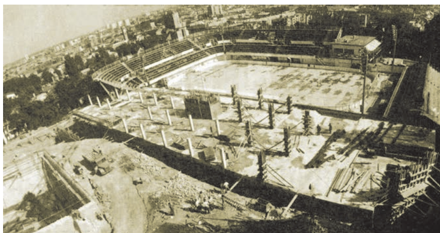
Pogled s dizalice na gradilište na Šalati (iz reportaže)

Međutim u brojevima 2, 5 i 12 iz 1986. opisana su ondašnja gradilišta u Zagrebu za uoči Univerzijade '87 – Sportsko-re-