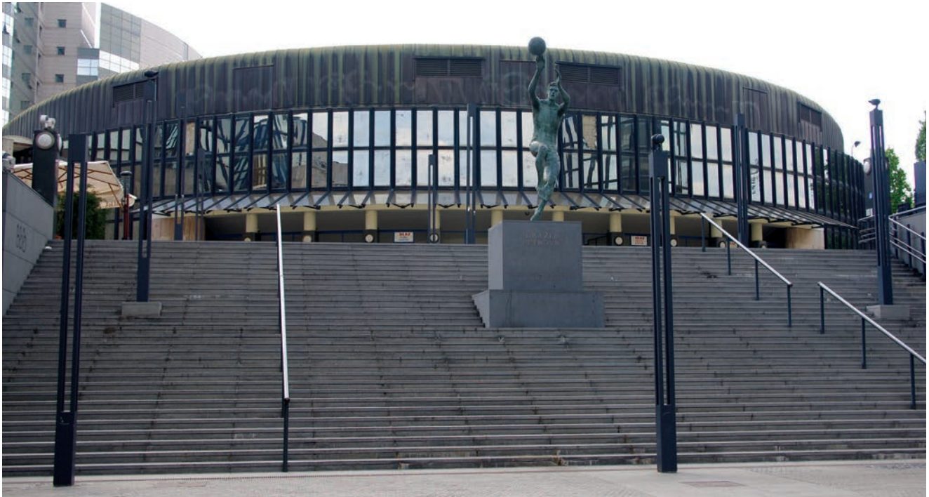
Sadašnji izgled Cibonine dvorane

pred njihovim očima raste budući visoki neboder (91,5 m), inače središnji sadržaj cijeloga kompleksa.