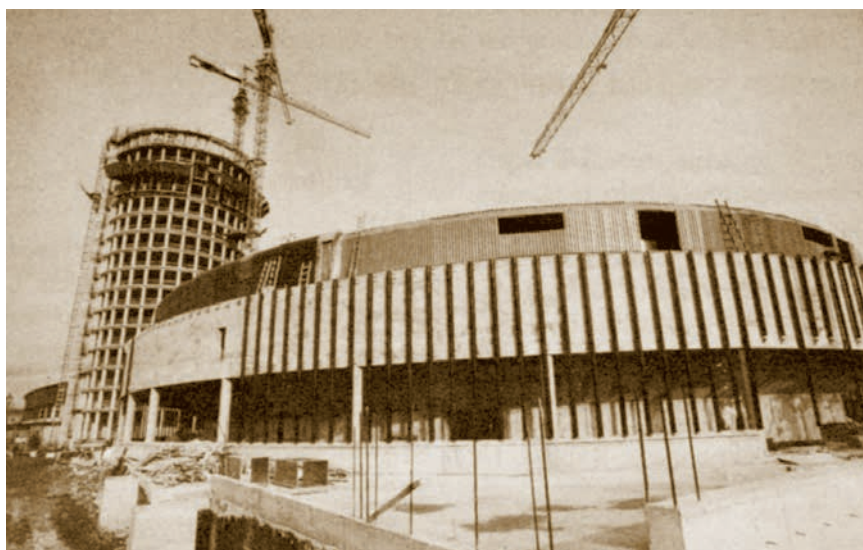
Gradnja dvorane Cibona

tantima, posebno stoga što bi gradilište Cibona (tada se još vjerovalo da će se zvati Omladinski sportski centar) trebalo dobiti sve pohvale zbog brzine kojom su se radovi izvodili te organiziranosti i kvalitete. Uostalom, rečeno je, toj se budućoj sportskoj poslovnoj građevini, građenoj između željezničkih pruga te Savske ceste i Končareve ulice (sadašnje Tratinske), svi bezrezervno dive. Pritom uopće nije bilo važno je li riječ o sportskim ili drugim delegacijama koje su ga došle obići jer su to činili i prolaznici koji su bili zadivljeni činjenicom da gotovo svakodnevno