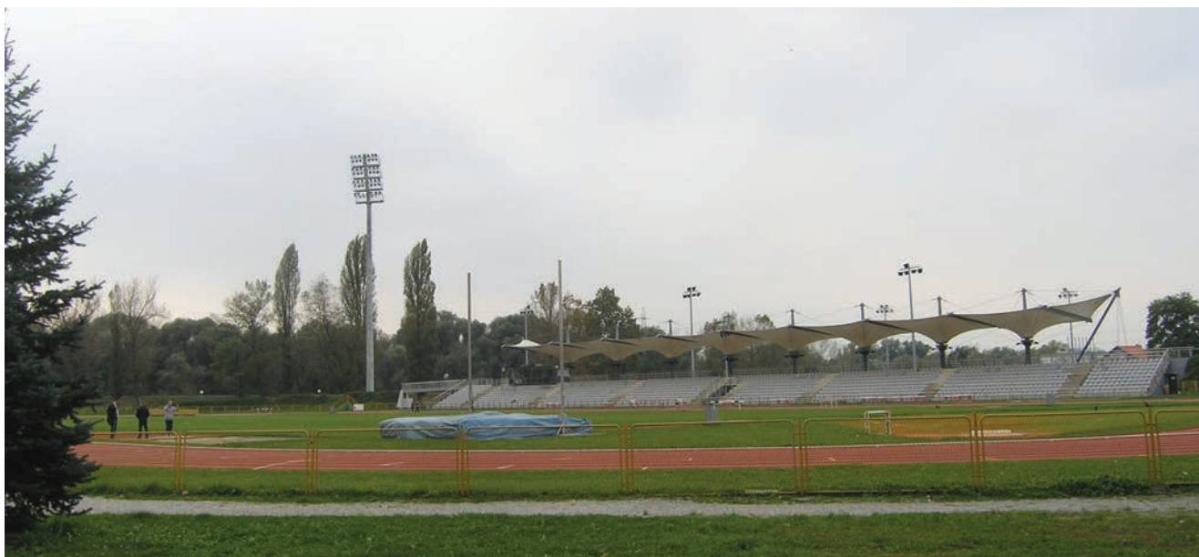
Atletsko borilište u Sportskom parku Mladosti

Može se reći, barem kada se promatra izvana, da je stanje Sportskog parka Mladosti vrlo dobro i da se njemu redovito održavaju raznovrsna natjecanja. Ne izostaju čak ni rezultati. Zabrinjava samo financijsko stanje nekih sportskih klubova koji nose naziv Mladost . To se osobito tiče atletičara, ali i nekad slavni vaterpolista koji su zbog tih problema otpali iz borbe za naslov državnog prvaka. Čini se da je stanje većine klubova iz društva Hrvatski akademski sportski klubovi Mladost Sveučilišta u Zagrebu (osnovanog 1903.) vrlo loše, jer ni nakon dugotrajne pretrage nismo uspjeli pronaći podatak o njihovu sjedištu, pa čak ni telefonski broj.